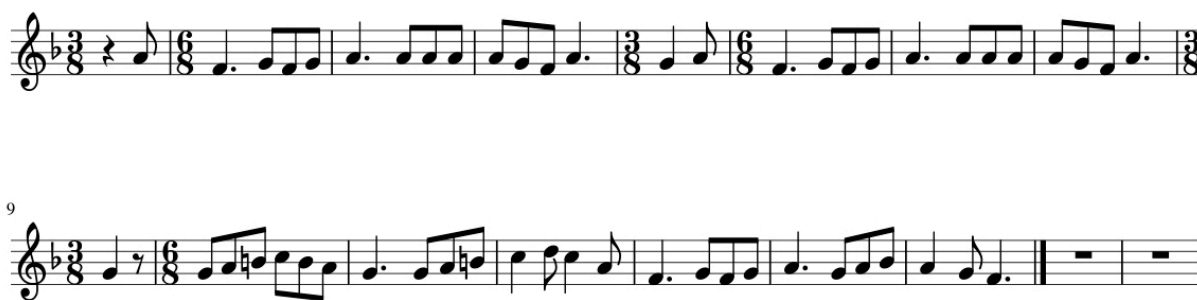
Exemple 1a. Soldat par chagrin (Réf. 515, Tab. 3), thème, mes. 1-15

Le thème de la chanson (ex. 1a.) est écrit en Fa Majeur (Mes. 1 à 9) puis module en Do Majeur (Mes. 10 à 15).