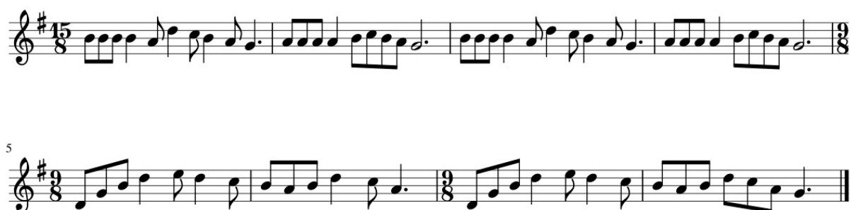
Exemple 3. Magali (Réf. 506, Tab. 3), thème

Facile à chanter, sa première partie montre un espace mélodique pas plus large qu'une quarte, ainsi que des mouvements descendants en notes conjointes (mes. 1 – 4), sans autres valeurs que des noires et des croches. Dans sa deuxième partie (mes. 5 – 8), le deuxième renversement d'un accord parfait majeur de Sol est arpégé puis amène les chanteurs jusqu'à la note la plus haute du thème, un mi. Des intervalles de tierces viennent eux aussi enrichir et varier le matériau mélodique du thème, évitant la monotonie, alors que les seules valeurs employées restent la noire et la croche. L'arrangement se saisit de ce matériau simple pour en proposer un accompagnement en variation permanente qui varie aussi l'emploi du chœur complet, des différents solistes (homme et femme), jusqu'à organiser un canon entre le chœur des femmes et celui des hommes, sur la deuxième partie du thème.