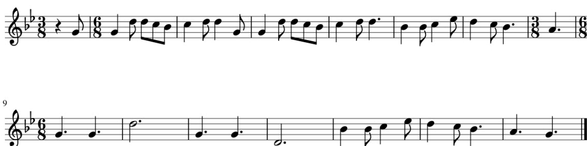
Exemple 2 Le bouvier (Réf. 524, Tab. 3), thème

La pénibilité du labeur du bouvier est représentée par trois accords dissonants, plaqués avec force et à la sonorité massive, sur les injonctions du bouvier à ses bêtes – Ah ! Oh ! Uh ! (ex. 2 : mes. 9 – 11) – qui introduisent la première strophe, puis reviennent sans cesse. [40] Ainsi, le travail du bouvier est inséparable de ses souffrances et de sa pauvreté. Il est aussi la cause du malheur qui va bientôt frapper sa femme, et qu'évoque son mari quand il l'interroge sur sa santé. Soudain un accord, joué morendo (1'28"), le laisse attendre et annonce la parole de son épouse. Si elle n'est pas encore certaine de mourir, la musique la dit pourtant déjà condamnée. Les strophes 5 et 6 (de 2'01" à 3'09"), sont en effet accompagnées par un orgue seul, qui semble déjà jouer, évoquant l'église, pour l'office funèbre de Jeannette. À ce dépouillement musical, évocateur du dépouillement matériel et bientôt de la solitude du bouvier, font contraste les trois derniers accords de la chanson. Joués doucement, par les cordes, sur les injonctions du bouvier, ils sont cette fois majeurs, et éclaircissent finalement cette atmosphère pesante. La mort de Jeannette est en effet la promesse de son repos, dont les pèlerins assureront la bénédiction.