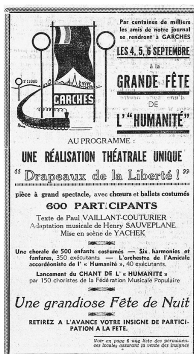
Figure 2. Affiche pour la Fête de l'Humanité (« L'Humanité », 24 août 1937)

À partir de 1936, Sauveplane publie beaucoup dans « L'Humanité ». Ses contributions portent sur la vie musicale et chorégraphique parisienne, les œuvres nouvelles, les compositeurs – tels que Grieg, Strauss, Debussy, Ravel, Roussel, Honegger, Prokofiev –, mais aussi sur des thèmes historiques et sur l'éducation musicale. Le 16 février 1936, dans son article Musique et chants révolutionnaires , écrit en marge de la tenue du concert des Chants de la liberté , Sauveplane différencie musique et chant, considérant ce dernier comme le fruit de l'effort collectif et la voix d'un peuple. [11] Il attribue ainsi aux paroles une valeur historique et politique supérieure à celle de la musique, [12] et se laisse deviner comme un compositeur au service de la sublimation du texte qu'il doit mettre en musique, pour maximiser son effet politique. Peut-être met-il en pratique cette éthique dans deux de ses travaux de 1937: [13] les musiques du Chant de l'Humanité et de la pièce de théâtre Drapeaux de la Liberté ! , paroles et textes écrits par Paul Vaillant-Couturier, tous deux joués pour la fête de « l'Humanité ». Le Chant de l'Humanité est créé le 5 septembre 1937 par 150 choristes de la FMP. Drapeaux de la Liberté ! rassemble les 4, 5 et 6 septembre une chorale de 500 enfants, 350 musiciens d'harmonie et un orchestre d'accordéons (voir Fig. 2). Tout ici laisse en effet à penser la réalisation d'une conception politique de la musique mise au service du peuple.