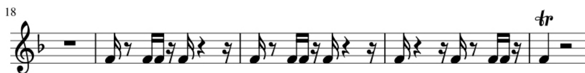
Exemple 1b. Soldat par chagrin (Réf. 515, Tab. 3), motif rythmique du tambour

Sur un tempo andante , l'arrangement de la première strophe est discret. Le tambour (ex. 1b) et la trompette (ex. 1c) jouent chacun un motif rythmique identifiable à un topipe militaire.