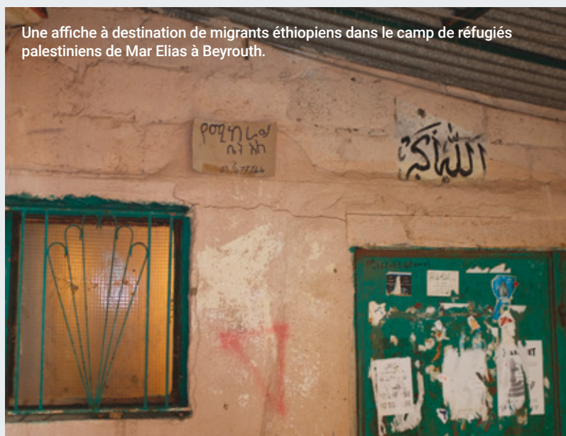
Une affiche à destination de migrants éthiopiens dans le camp de réfugiés palestiniens de Mar Elias à Beyrouth.

La plupart des travailleurs migrants, qu'ils soient originaires du Moyen-Orient, d'Asie du sud ou d'Afrique, occupent des emplois peu qualifiés et pour certains précaires. Pour ceux qui travaillent dans le secteur informel ou comme journalier dans l'agriculture ou la construction, le confinement a été synonyme de perte de leur