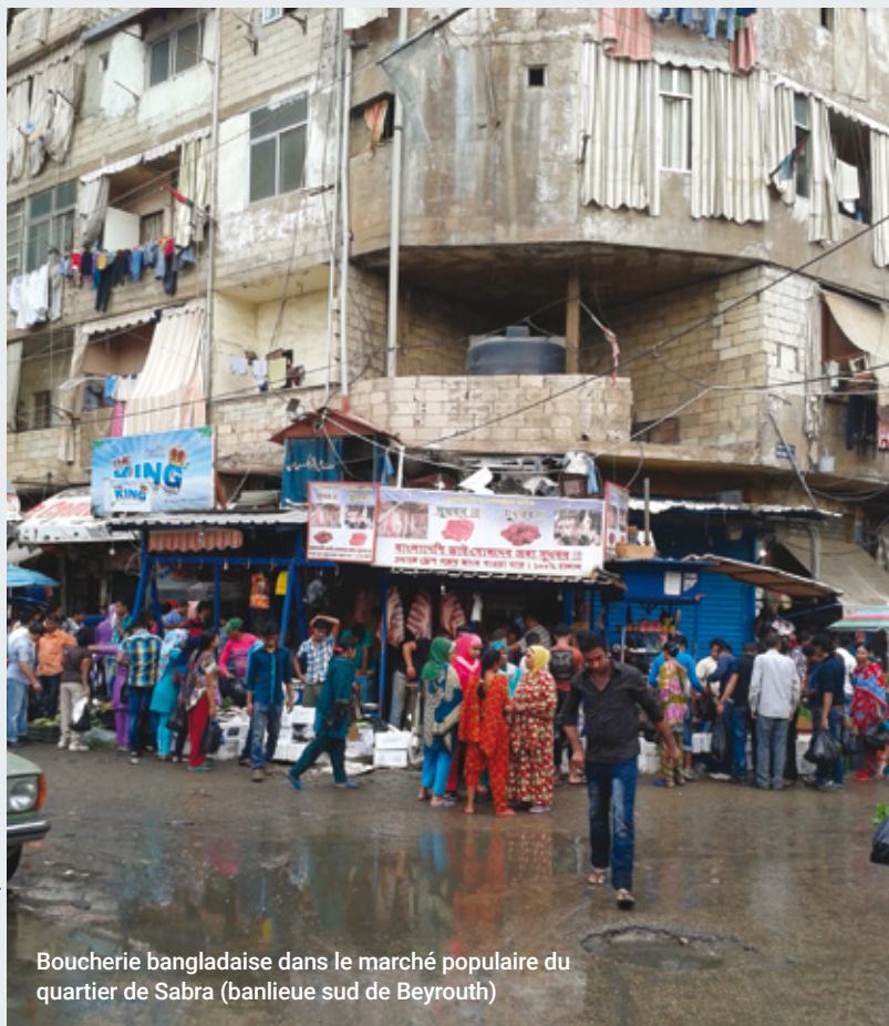
Boucherie bangladaise dans le marché populaire du quartier de Sabra (banlieue sud de Beyrouth)

➤ Kamel Dorai (Institut Français du Proche-Orient, Beyrouth)