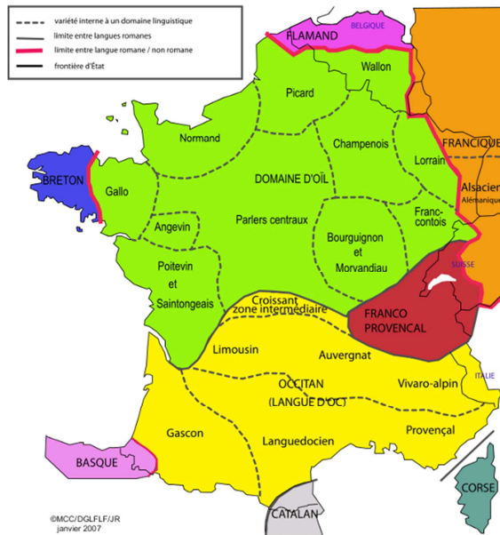
La zone du Croissant au sein de l'espace gallo-roman

La zone linguistique du Croissant constitue la zone de transition entre les parlers d'oïl et les parlers d'oc (Brun-Trigaud 1990, 19). Elle présente sur les cartes une forme de demi-lune, d'où le terme de « Croissant », créé par Ronjat (1913, 6-7). Plus précisément, cette zone marque la transition entre les variétés nord-occitanes (limousin, auvergnat) et plusieurs variétés d'oïl (poitevin-saintongeais, berrichon, français).