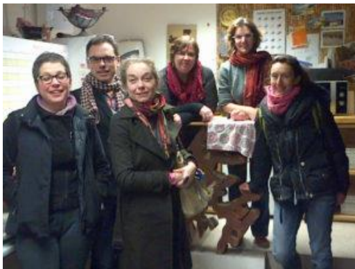
Réunion Commission Recherche, Cresson, 2014

La documentaliste du CERMA y crée une commission de travail en 2011 pour les bibliothèques recherche des écoles ; celle-ci se réunit régulièrement depuis, et partage un espace collaboratif dans l'intranet du MCC jusqu'à la mise en ligne de son carnet de bibliothèque dans hypothèse en 2017. La documentaliste CRESSON en a été co-rapporteur pendant cinq ans, remplacée par celle du CRENAU. La veille en IST réalisée par la documentaliste CRENAU est consultable depuis avril 2017 dans le carnet.