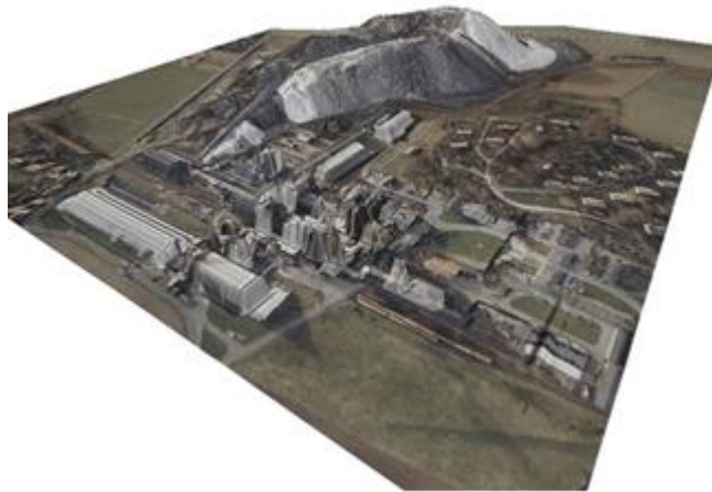
Figure 3: Extrusion des bâtiments à partir d'une orthophotographie, réalisée sous Grass GIS

satellites, de données « raster » (tous les formats d'images existants), de fichiers vectoriels (tous types de formats à l'import et à l'export : « .tab », « .shp »), toutes les analyses statistiques. De plus, il possède un module de visualisation des surfaces en trois dimensions (nommé NVIZ Visionneuse 3D) pouvant générer des MNT (Modèles Numériques de Terrain) en intégrant même le bâti (import des fichiers Autocad « .dxf »...) et d'en exporter une séquence animée.