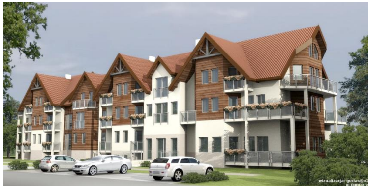
Figure 6 : Rendu final du même projet

Autre outil, plus ergonomique que Blender, Google Sketchup 42 est un logiciel de modélisation 3D essentiel en cartographie et en architecture. Par rapport aux autres logiciels 3D, Sketchup 43 fonctionne selon les principes de l'inférence : il émet des propositions en fonction de ce que l'utilisateur réalise. De plus, à la différence des autres logiciels de modélisation 3D, Sketchup permet de modéliser en temps réel. L'utilisateur travaille directement sur le volume en extrudant 44 ses faces, ajoutant une forme, tant et si bien qu'il devient facile de réaliser ses premiers bâtiments. Le rendu sous Sketchup permet d'obtenir