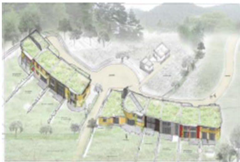
Figure 1: Le projet Écolline, à Saint-Diè-des-Vosges Source : Ascendance Architecture, réalisé sous Sketchup)

Le projet Ecolline illustre la nouvelle tendance, en France, selon laquelle les citoyens développent, en expérimentant une nouvelle façon d'habiter, leur territoire : il s'agit de repenser les pratiques, de partager de nouvelles expériences, de changer les comportements, d'inventer d'autres usages et de réapprendre à vivre ensemble. Ecolline n'est donc pas seulement un projet de construction durable, il s'agit aussi d'une expérience humaine. Issue d'une réflexion et d'une démarche collective, elle repose sur un « projet de vie en harmonie avec les idées de partage, de solidarité, d'échanges, de vie saine, de modifications des comportements de consommation et de respect de l'environnement » (extrait des statuts de l'association Ecolline). La dimension sociale transparait dans l'ensemble des entretiens réalisés : « Pour chacun, il a été question de faire un travail sur soi et vers les autres, trouver un équilibre et faire des compromis pour prendre des décisions à l'unanimité... L'écoute, la remise en question et la communication ouverte et non violente sont les garants de la réussite » (membre de l'association). La cohabitation est pensée et le projet articulé autour des espaces collectifs. Les habitants mutualisent certains espaces, tout comme les commandes de matériaux, les échanges de savoir-faire, et s'entraident dans la construction.