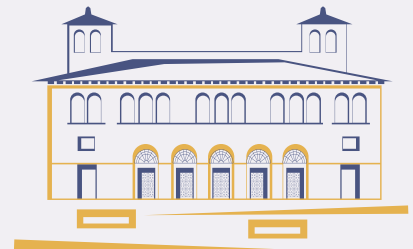
Faculté de droit et de science politique à Aix-en-Provence