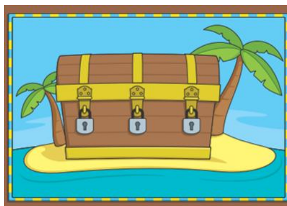
Figure n°1 : le plateau du jeu Grapho-Logic

Le jeu d’orthographe approchées que nous présentons ici est issu d’une démarche collaborative de 3 années entre enseignants-chercheurs, conseillers pédagogiques de circonscription et professeurs des écoles. Il est destiné à des élèves de grande section de maternelle. Il vise à leur permettre de découvrir la dimension phonographique de l’orthographe du français, c’est-à-dire a) découvrir qu’en français, les signes graphiques utilisés servent le plus souvent à coder des sons ; b) développer quelques connaissances liées au principe alphabétique et à la combinatoire. Ce jeu de plateau s’appelle Grapho-Logic. Les élèves doivent réaliser des tâches. Lorsqu’ils réussissent une tâche, ils ouvrent un verrou tenant un coffre fermé (voir figure 1 ci-dessous : le plateau de jeu).