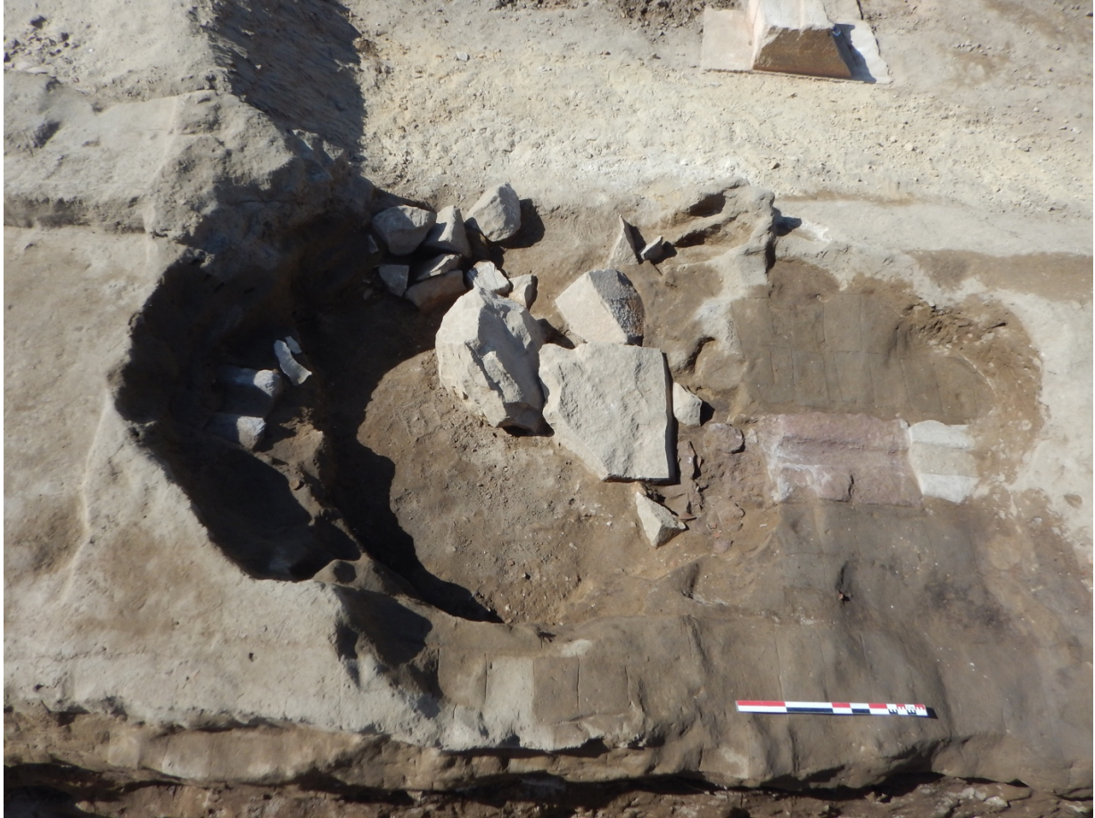
Fig. 5. La fosse (en cours de fouille) sectionnant la canalisation et le mur d'enceinte.

Sur la limite nord de la fouille, implanté sur un épais remblai de terre compacte scellant la canalisation, un vase de stockage (eau, denrées ?) de grandes dimensions ( \varnothing interne : 66 cm ; profondeur : env. 38 cm) est enchâssé dans une structure en briques cuites (fig. 6-7). Cette structure doit probablement dater du V e siècle, comme celle moins bien conservée mise en évidence la saison passée. Elles sont vraisemblablement à mettre en relation avec l'activité d'épierrement du temple.