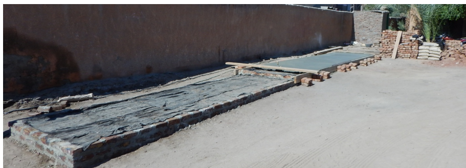
Fig. 14. Construction en cours d'une banquette (dépôt lapidaire).

Une banquette lapidaire (1,75 x 13,50 m) a été aménagée à proximité de l'inspectorat ; elle accueille des chapiteaux et colonnes romano-byzantins, et des blocs et fragments de statues. À la demande des inspectorats d'Esna et de Louqsor, le mur moderne en briques cuites ceinturant le site a été surélevé : une première tranche a concerné le tronçon sud-ouest, surélevé de quatre assises de briques.