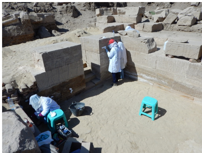
Fig. 13. Restauration-conservation des cryptes n os 1 et 2.