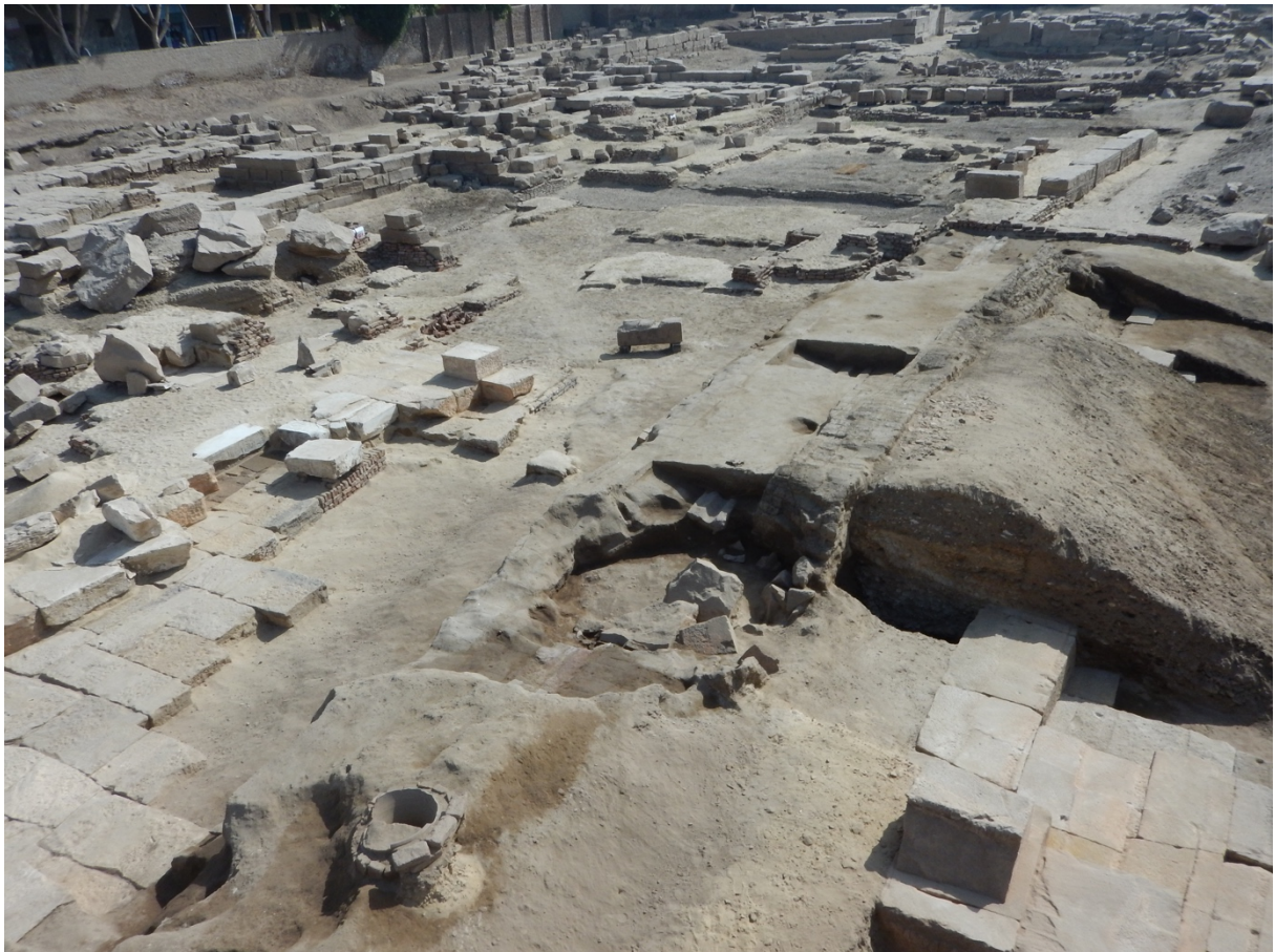
Fig. 1. Vue générale du secteur ouest étudié.