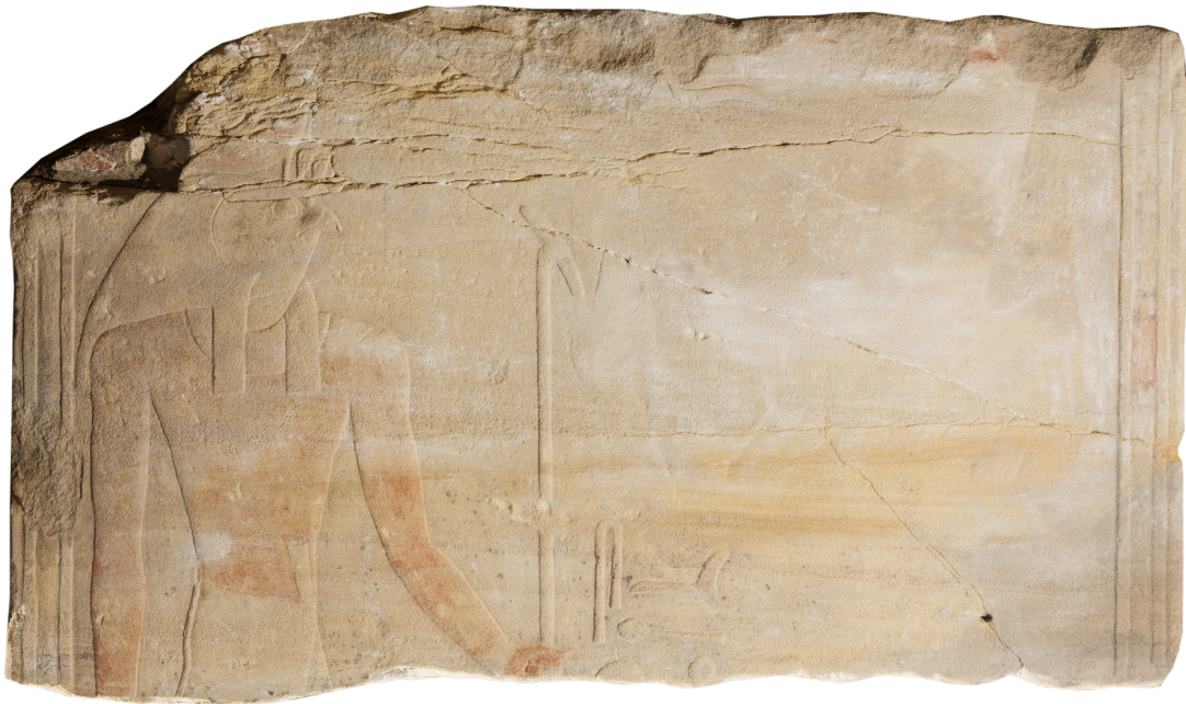
Fig. 12. Montou face à Hatchepsout (effacée).

Un bloc identifié en 2008 dans les fondations du pronaos qui appartient à une scène de couronnement de la reine Hatchepsout par Amon a fait l'objet d'une attention particulière cette année. L'impossibilité de l'extraire des fondations rendait sa lecture délicate. La réalisation d'une orthophotographie à partir de dizaines de photographies prise au plus près de la surface du bloc dans l'espace laissé libre dans le joint avec le bloc adjacent a permis d'obtenir une photographie complète 3 autorisant ainsi la production d'un fac-similé d'une des faces du bloc et confirmant un raccord avec un autre bloc de la façade du pronaos extrait en 2014 appartenant également à cette scène de couronnement de la reine Hatchepsout.