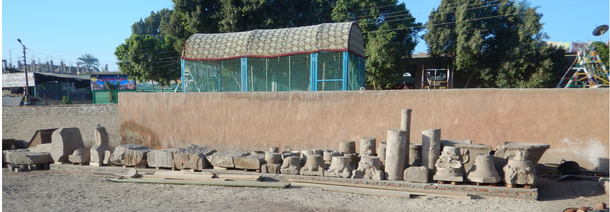
Fig. 15. Dépôt de blocs sur la banquette.