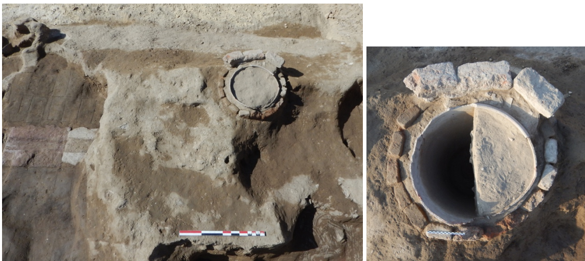
Fig. 6-7. Le vase de stockage avec son chemisage de briques cuites.

Sur la limite nord de la fouille, implanté sur un épais remblai de terre compacte scellant la canalisation, un vase de stockage (eau, denrées ?) de grandes dimensions ( \varnothing interne : 66 cm ; profondeur : env. 38 cm) est enchâssé dans une structure en briques cuites (fig. 6-7). Cette structure doit probablement dater du V e siècle, comme celle moins bien conservée mise en évidence la saison passée. Elles sont vraisemblablement à mettre en relation avec l'activité d'épierrement du temple.