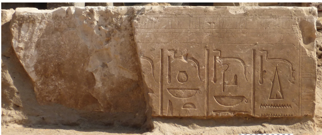
Fig. 11. Bloc de calcaire (Amenemhat I er ) remployé à l'ouest du naos ptolémaïque.

Les blocs les plus significatifs et les mieux conservés sont ceux proviennent de grandes scènes du temple d'Amenemhat I er (fig. 11). Ils représentent, de façon usuelle, le roi faisant offrande ou accomplissant un rituel devant le dieu Montou, maître de Thèbes. Les inscriptions préservées permettent d'identifier les protagonistes (protocole et épithètes royaux, noms des dieux) et fournissent ainsi quelques clés de compréhension des scènes.