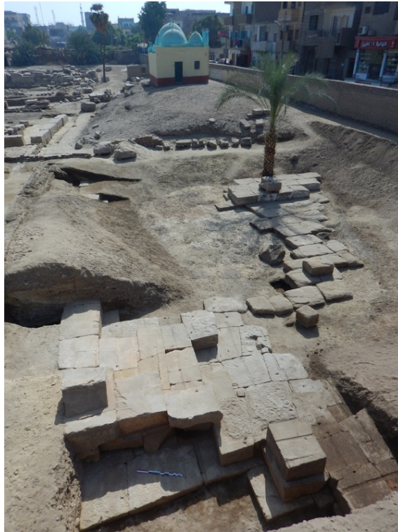
Fig. 9. Fondations du « temple ouest » ; au premier plan la partie mise au jour.