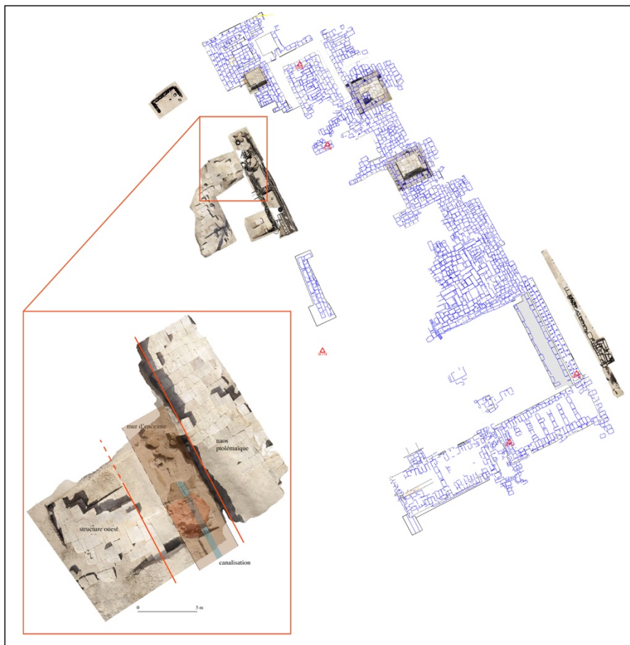
Fig. 10. Orthophotographie partielle des fondations du naos ptolémaïque et du « temple ouest » sectionnant le mur d'enceinte en briques crues ; les traits rouges soulignent les tracés de pose.