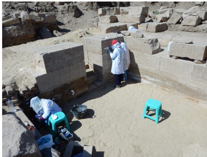
Fig. 13. Restauration-conservation des cryptes n os 1 et 2.