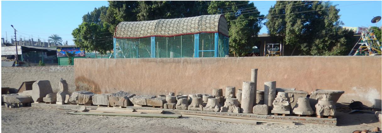
Fig. 15. Dépôt de blocs sur la banquette.