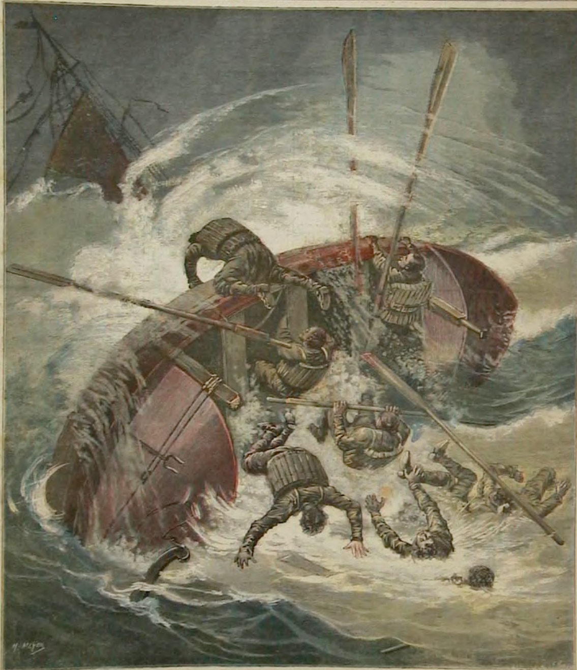
Les dernières tempêtes