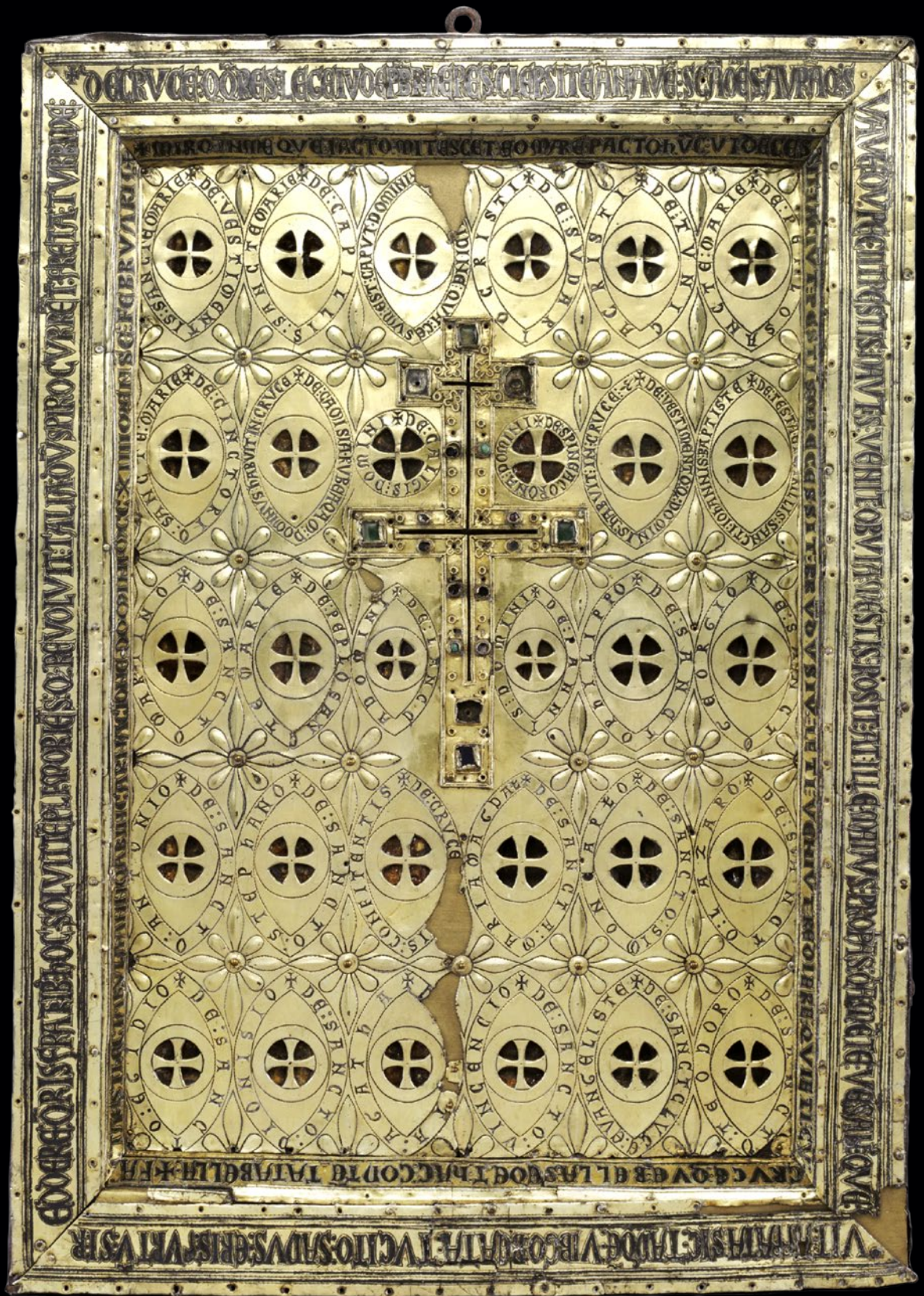
3/ Le reliquaire de la Vraie Croix, ca. 1214. Croix : royaume latin de Jérusalem; panneau : Meuse-Rhin, 44 × 31 × 4,7 cm / Cleveland Museum of Art, 1952.89