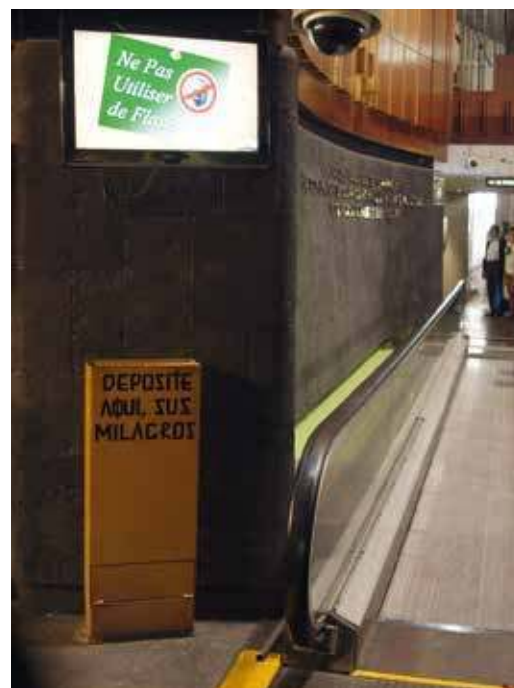
15. Récipient à ex-voto Basilique Notre-Dame de la Guadalupe, Mexico, 2016

Qu'il s'agisse d'institutions ecclésiastiques ou municipales, ces autorités cherchent à prendre le contrôle d'une expression qui les déborde. De Venise à Paris, les cadenas d'amour sont démontés,