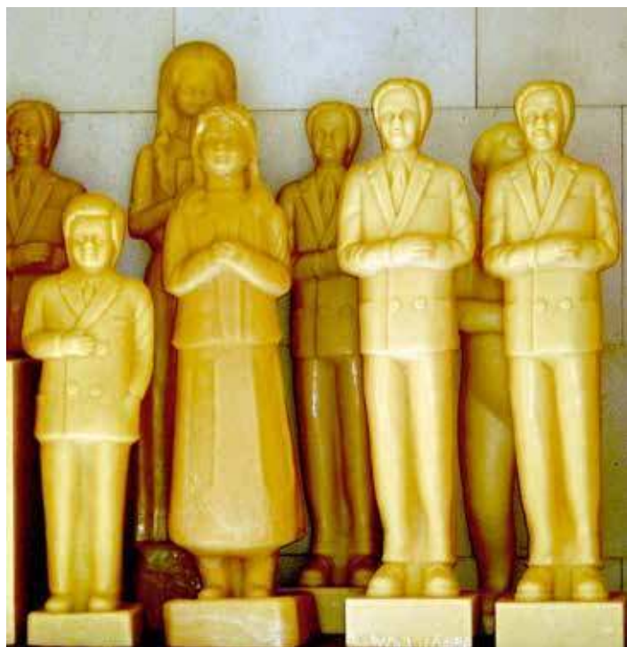
11. Les ex-voto en cire de Fatima ont vocation à brûler et à se fondre. Ex-voto, Fatima, 2008

Il faut d'abord considérer les dépôts votifs qui s'inscrivent dans une vie cyclique . Qu'il s'agisse d' ex-voto anatomiques en cire ou en métal, de simples bougies, ou de mottes de cire, nous sommes face à des objets sériels produits dans un cadre industriel ou proto industriel, qui impliquent une anonymisation des corps et des désirs. Objets pauvres, standardisés, mille fois moulés et démoulés, ces dons s'inscrivent généralement dans une temporalité rapide : achetés sur les lieux mêmes des pèlerinages, leur temps de vie est largement encadré par des institutions qui gèrent les temps d'exposition, installent ou enlèvent ces objets en fonction des flux, assumant ainsi les modalités pratiques de la médiation avec la