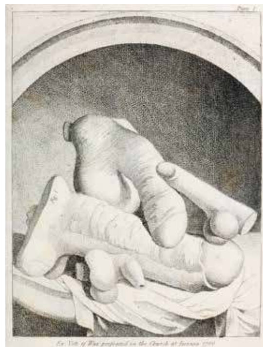
1. Page de titre de l'ouvrage An account of the remains of the worship of Priapus lately existing at Isernia, in the kingdom of Naples , 1786