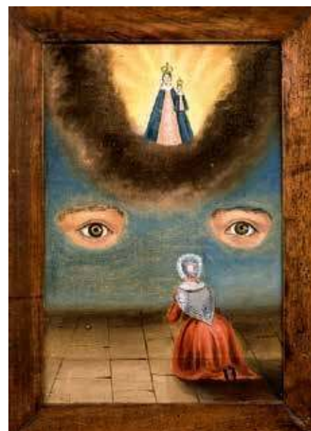
13. Ex-voto à la Vierge Wintzenheim, chapelle Notre-Dame-du-Bon- Secours

Ce troisième temps est déjà d'aujourd'hui : ainsi, au Mexique, au Brésil ou en Italie, la photographie votive fait-elle l'objet d'un véritable travail collectif : l'accident ou l'opération « miraculeuse » sont documentés de l'extérieur, par des photographies de proches, parfois mises en