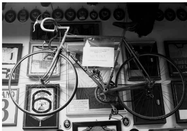
10. La bicyclette de Merckx

Existe-t-il une solidarité mesurable entre ces valeurs dans l'ex-voto ? Un objet qui coûte cher, à forte valeur d'échange, possède-t-il une grande valeur d'usage et une grande valeur de lien ? Contrairement à ce que pourrait suggérer l'évidence de la logique marchande, il n'existe pas de relation proportionnelle mécanique entre les valeurs de l'ex-voto. L'offrande d'un ex-voto n'est pas assimilable à l'achat d'un service, comme pourrait le laisser croire une certaine pensée utilitariste marquée par le capitalisme. L'acte de donation s'accompagne en effet généralement de toute une série de gestes rituels, de prières, de demandes, de productions d'affects qui ne sont pas quantifiables. Un grand pécheur du XIII e siècle peut décider de