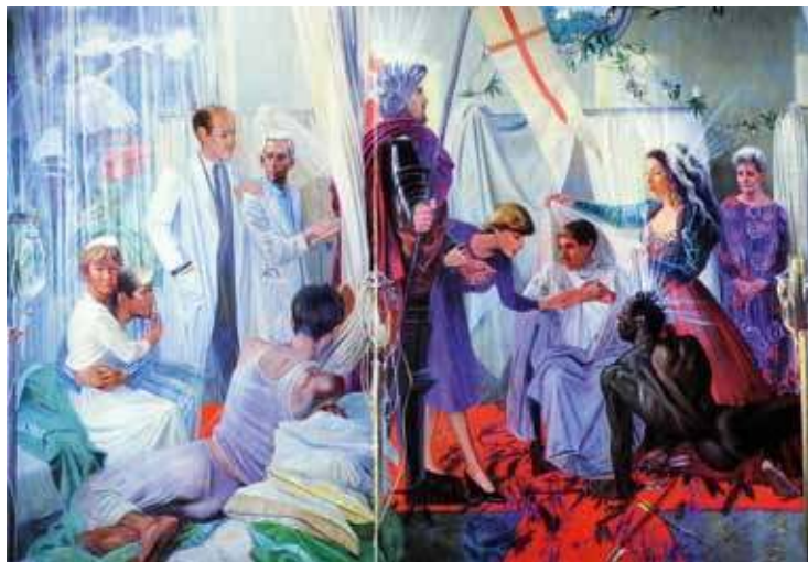
2. Votive Offering (Détail). En 1987, cet ex-voto peint d'André Durand célèbre, à sa manière pleine de clichés douteux, l'inauguration du premier service dédié aux malades du SIDA par la princesse de Galles, Lady Di. Celle-ci sera après sa mort la destinataire de nombreux vœux.

En centrant notre définition sur le don, nous inscrivons l'ex-voto au registre des grands thèmes de l'anthropologie. Il faudra tirer parti de la vaste historiographie de l'anthropologie du don pour comprendre que la pratique votive ne relève pas de l'échange marchand, mais qu'elle est tout autant en opposition avec une interprétation théologique du don comme manifestation d'un « pur amour » (Le Brun 2002) 3 . De plus, l'ex-voto ne doit pas être confondu avec le sacrifice, même s'il en partage certains traits, ni ne peut être assimilé à toute offrande religieuse. L'ex-voto n'est pas seulement un don, c'est un don public accompagné d'une promesse, d'un vœu, d'un désir. Pourquoi est-il plus efficace d'accompagner la formulation de ce désir par un don matériel ? C'est la question qui traverse tout ce numéro.