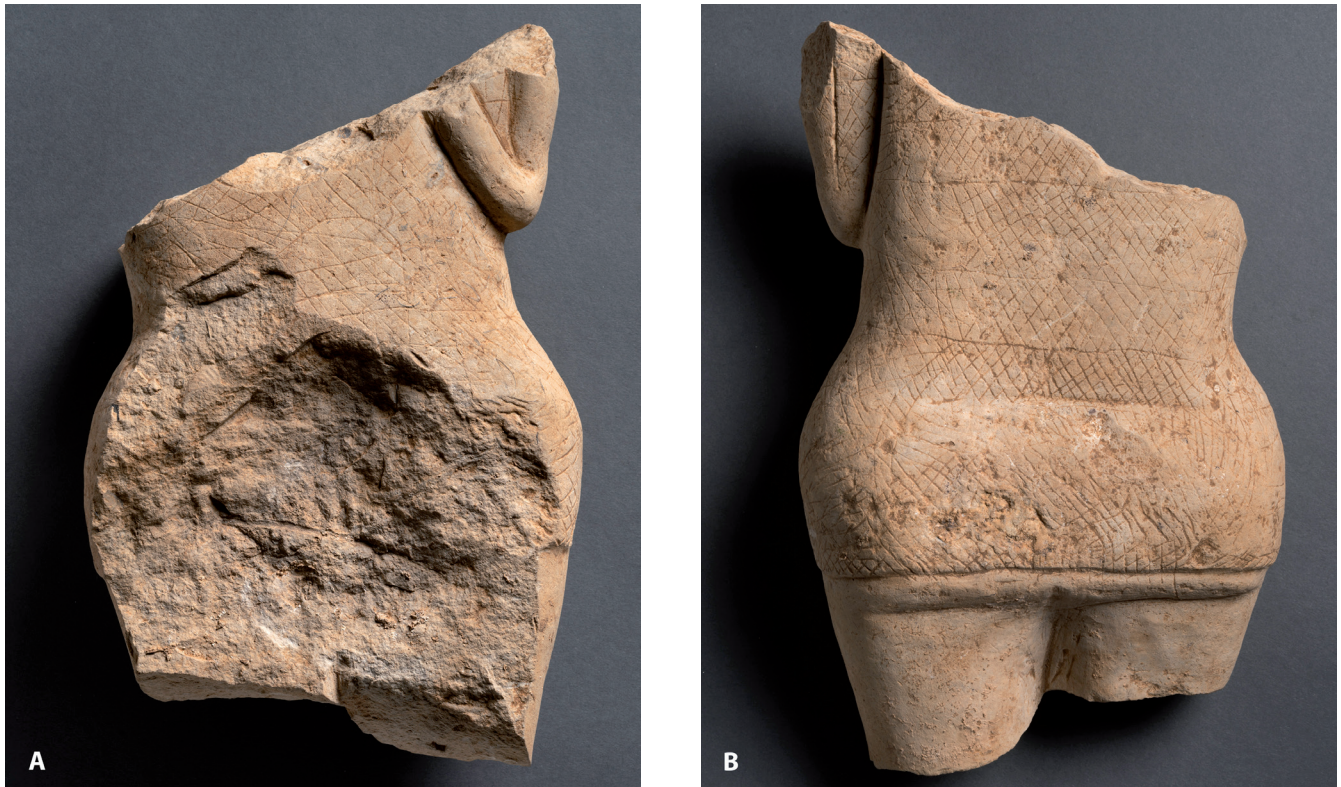
Fig. 3. A. La statue en calcaire découverte sur le sanctuaire de Couan, vue de face. B. Le revers de la statue.

l'ouest. Sur celle-ci ont été édifiés les murs du temple à plan centré et ceux du péribole. À l'est, une tranchée a recoupé le grand bâtiment nord-sud, dont l'aménagement peut être subdivisé en deux phases successives entre le milieu du I er siècle et le III e siècle de notre ère. À l'ouest, en dehors du péribole, plusieurs niveaux de circulation, dans lesquels ont été récoltées de très nombreuses monnaies (dont un dépôt de la fin du IV e siècle), ont été étudiés. Enfin, une dernière étape de fréquentation est marquée par des processus de démantèlement et de récupération, qui débutent dès les années 360 de notre ère. À celle-ci se rattache, entre autres, une imposante cavité au milieu de la cella , qui n'a pu être entièrement explorée vu sa profondeur remarquable.