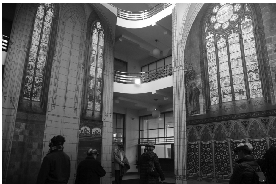
Photographies de l'exposition Boulogne a 700 ans .