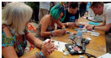
Atelier de montage de capteurs – Makers, Nantes 07/2019