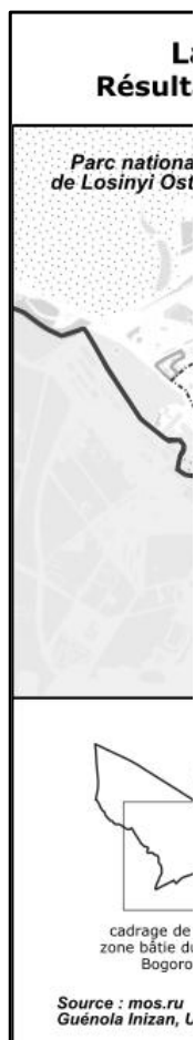
Figure 3 : Résultat du vote des habitants à Bogorodskoe