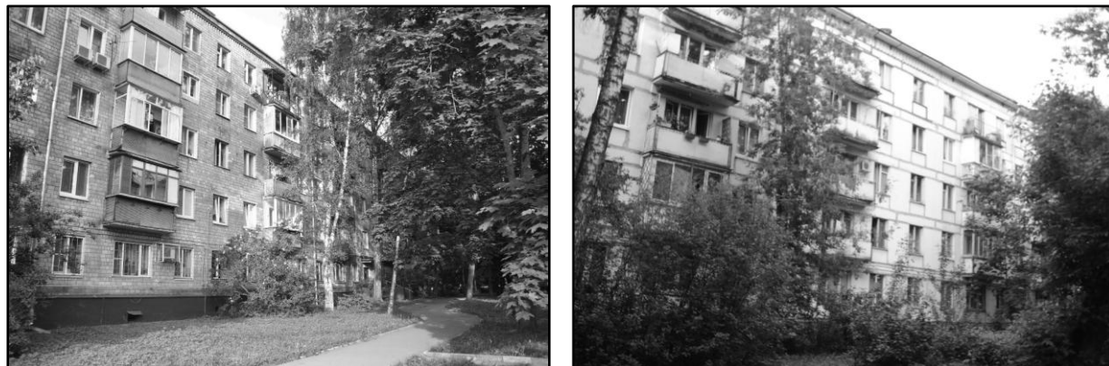
Figure 2 : Piatietajki en brique (g.) et en béton (dr.), Bogorodskoe, mai 2019.

Le manque de données ne permet pas de mettre statistiquement en relation le vote (pour ou contre la rénovation), les propriétés sociales et les statuts d'occupation. Les entretiens viennent en revanche éclairer ces réactions inégales : en fonction de leurs positions et trajectoires sociales et résidentielles, les habitants se retrouvent en position de « perdre » ou de « gagner » face à la rénovation.