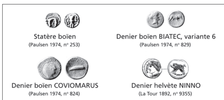
Fig. 3. Exemples de représentations chez les Boïens et les Helvètes.