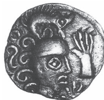
Fig. 4. Monnaie en argent hongroise conservée au musée de Budapest (Megaw, Megaw 2005, p. 157).

chevelure ou dans le visage du profil du droit. Sur le statère des Boïens, le sanglier occupe le motif central au revers (Paulsen 1974, n°248-256). Sur les statères en billon des Osismes (La Tour 1892, n°6541), un sanglier-enseigne orne le pourtour de la chevelure du visage à l'avant. Près d'une quinzaine de types de monnaie en argent a été recensée à travers l'Europe celtique. Sur les types éduens, il s'agit essentiellement du sanglier-enseigne, porté par le soldat (La Tour 1892, n°4336, 4484, 5026, 5044 et 5075). Chez les Helvètes, le sanglier est représenté de manière plus réaliste (La Tour 1892, n°9355), les poils hérissés, comme sur l'hexadrachme boïen COVIOMARVS (Paulsen 1974, n°922-825) (fig. 3). Chez les Ambiens (La Tour 1892, n°8514) et les Carnutes (La Tour 1892, n°6342), l'enseigne comporte encore le départ de la hampe. Il faut noter la découverte à Esztergom (Hongrie) d'une monnaie en argent représentant une tête portant un casque surmonté d'un sanglier (Megaw, Megaw 2005, p. 157) (fig. 4). Il s'agit de la seule représentation connue d'un casque de ce type sur une monnaie. Le motif du sanglier est très développé dans le monnayage en bronze de La Tène D2. Une