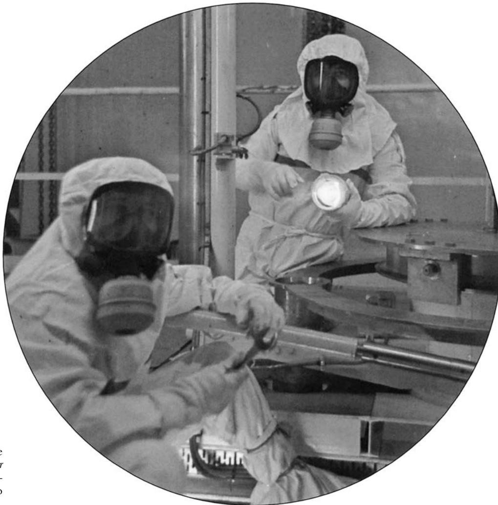
2. Tenue de travail en zone active (couverture du Dossier électronucléaire [CFDT de l'électronucléaire, 1980]).

l'instrument de comptage, le dosimètre-alarme qu'il porte sur lui, le lui signale, à s'interrompre en plein travail et à rejoindre la sortie de la zone active avec le sentiment d'être allé au-delà des limites. Si la surexposition a été forte, il devra procéder à un curieux – et presque magique – calcul du nombre de jours pendant lesquels il ne devra pas de nouveau recevoir de radiations, de façon à ce que la dose exceptionnelle qu'il a enregistrée n'excède pas le cumul des quantités quotidiennes maximales qu'il aurait été autorisé à recevoir en situation normale d'exposition.