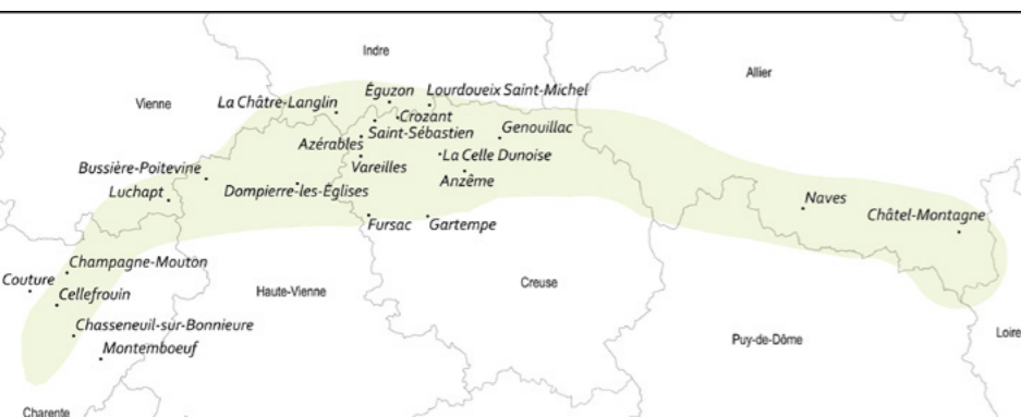
CARTE 2 - LA ZONE GÉOGRAPHIQUE DU CROISSANT, AVEC LE DÉTAIL DES COMMUNES © Guylaine Brun-Trigaud