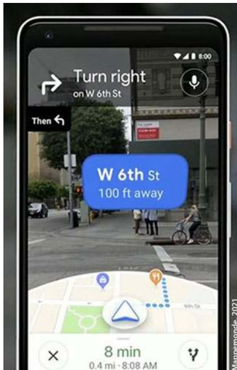
Figure 6. Capture d'écran de Google Maps AR