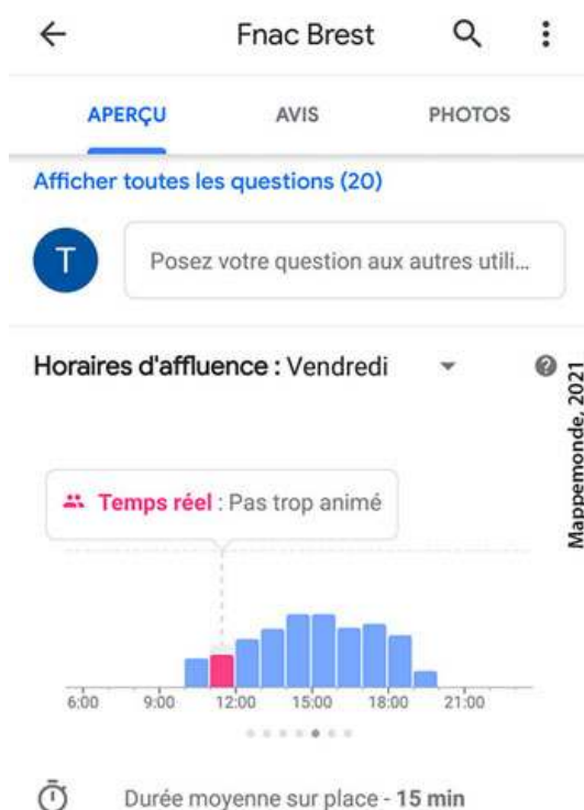
Figure 5. Affluence en temps réel estimée à la FNAC par Google Maps