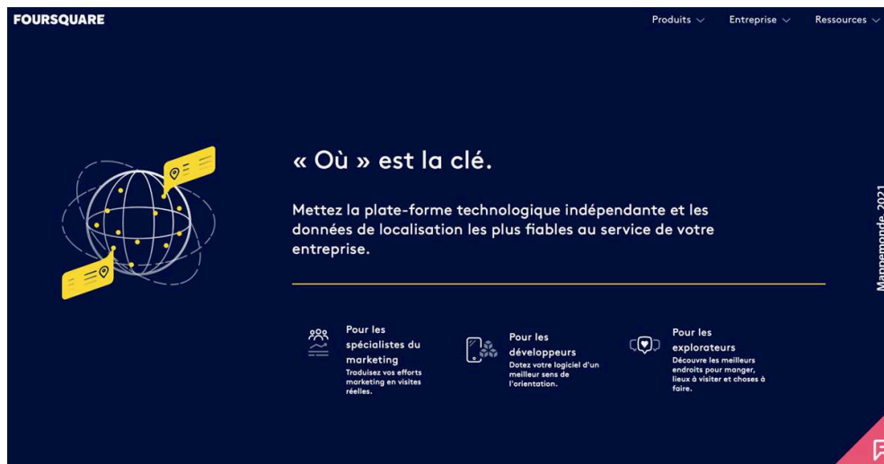
Figure 2. Page d'accueil actuelle de Foursquare, 11 ans après sa sortie