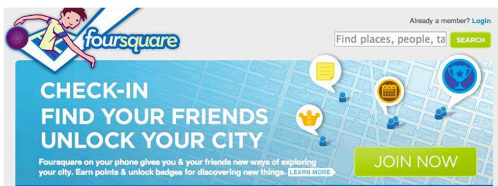
Figure 1. Une des toutes premières pages d'accueil de Foursquare