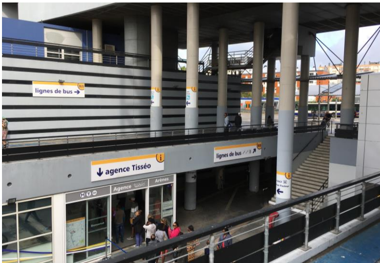
Photo 1 (Cyprien Richer, septembre 2017). Le hall d'échanges de la station de métro Toulouse Arènes. La gare SNCF est fléchée par le souterrain. A l'arrière-plan, on distingue le pôle bus et un TER à quai.

Photo 2 (Cyprien Richer, septembre 2017). Panorama du pôle d'échanges de Toulouse Arènes : de gauche à droite, la halte ferroviaire accessible par un passage souterrain, la gare routière pour les bus urbains, sous l'immeuble se trouve la station de métro (et derrière lui, une place avec un arrêt de tramway), et à droite, le stationnement du parc-relais. Selon Vaclav Stransky, l'organisation spatiale du PEM est un exemple d'espace représenté comme neutre et fonctionnel. Face à l'environnement bâti qui se démarque du reste du quartier par sa hauteur, sa densité et un parti pris moderniste, la fonction transport du pôle d'échanges sont d'une grande discrétion au point de n'être que peu apparentes depuis les voies environnantes : la gare SNCF et la gare bus sont dissimulées par les bâtiments des résidences universitaires, l'entrée de la station de métro se fait sous un bâtiment (Stransky, 2006).