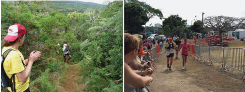
Fig. 4 Coureurs du Grand Raid et leur public

d'intérêt écologique majeur. Sans obtenir totalement gain de cause dans un rapport de force dont la presse locale se fait l'écho 10 , les organisateurs ont reçu du Parc national l'autorisation de passage de l'une de leurs courses (115 participants) sur ce sentier réhabilité, avec l'accord de l'ONF et des élus locaux, dans le cadre d'un projet touristique plus global dans ce secteur. Gestionnaires et pouvoirs publics font état de l'« exception Grand Raid », (Fig. 4), trail d'envergure internationale drainant aujourd'hui dans son sillage plusieurs courses (5 000 coureurs par an au total), revendiquant d'importantes retombées économiques directes et indirectes 11 pour le tourisme de l'île, tout en restant très populaire auprès des Réunionnais : « c'est un patrimoine de l'île », « c'est comme le carnaval pour Rio » (entretiens avec des coureurs, 2015).