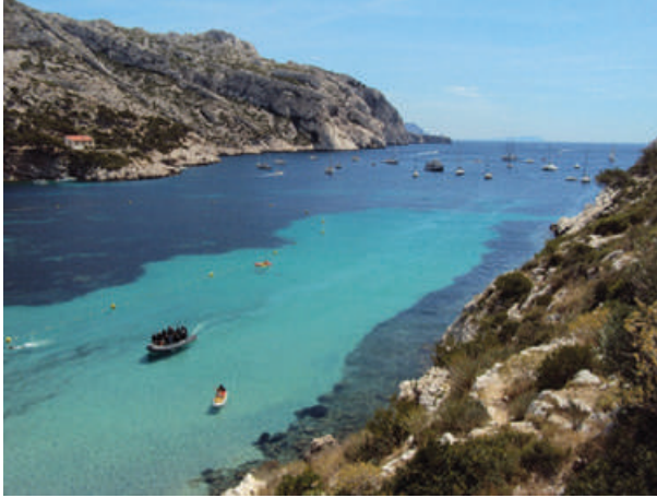
Fig. 1 La Calanque de Sormiou

ses impacts socio-environnementaux. L'enquête interdisciplinaire réalisée dans la calanque de Sormiou est (Fig. 1), en la matière, la plus aboutie de ce programme de recherche, car elle a permis d'associer enquêtes qualitatives et quantitatives auprès des usagers, suivi photographique et observations océanologiques 4 .