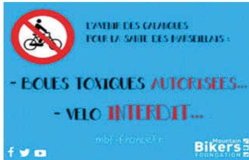
Fig. 3 Affiche d'un collectif de VTT, avril 2017

À la Réunion, le Parc national mène actuellement des expérimentations sur l'impact écologique 9 avec la participation des coureurs pour étayer cette régulation par le nombre, mais des critères éminemment sociaux et difficiles à évaluer interviennent aussi dans la fabrique collective de quotas différenciés selon les courses, processus dans lequel le PNRUn n'est pas toujours en position de force. Certains éléments d'appréciation – comme la « confiance » qui favorise les organisateurs déjà connus – sont justifiés par plusieurs décideurs au regard des enjeux de sécurité, tandis que les traitements d'exception renvoient à des rapports de pouvoir sur l'île qui s'imposent aux critères définis par le Parc national.