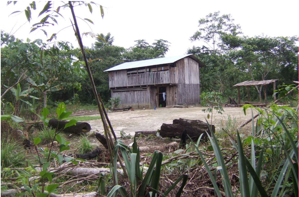
Image 1. Les Basses-Terres du Chapare

SOURCE : Laurence Charlier Zeineddine, 2017