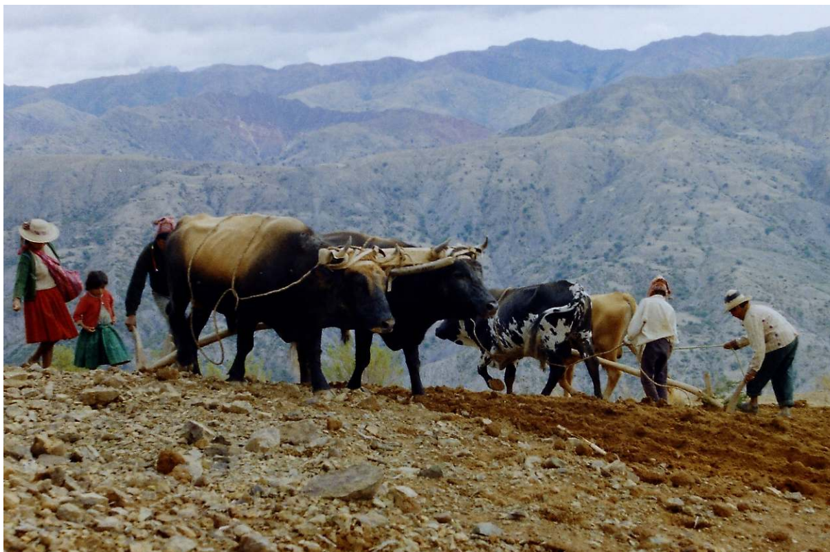
Image 4. Scène de labour dans les vallées du Norte Potosí