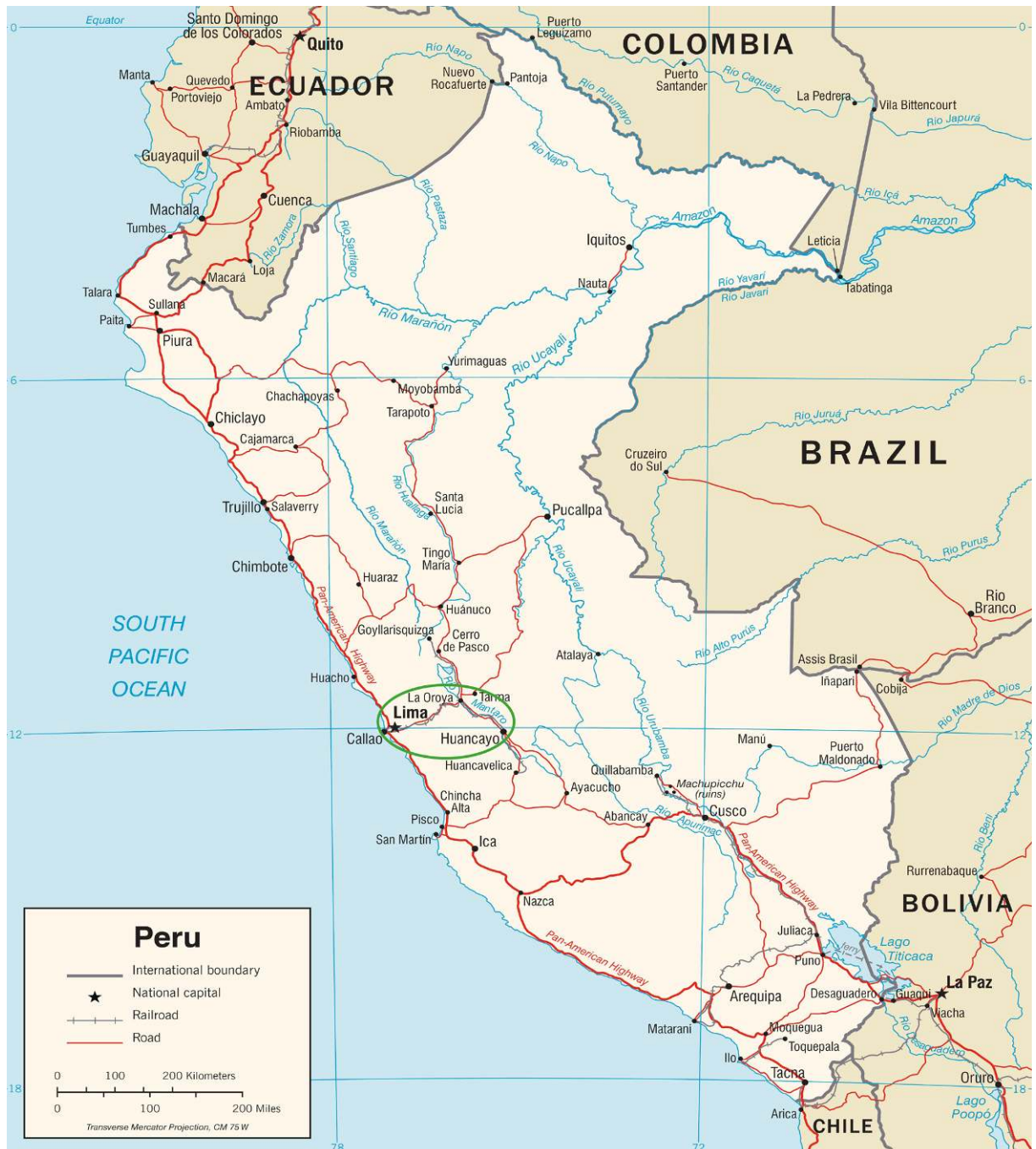
Figure 1. Carte routière du Pérou