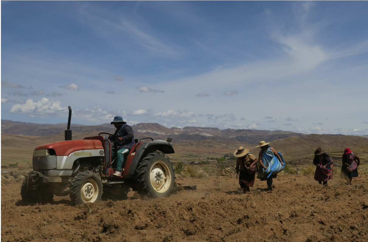
Image 2. Semaines de pommes de terre dans les Hauts-Plateaux du Norte Potosí

SOURCE : Laurence Charlier Zeineddine, novembre 2017