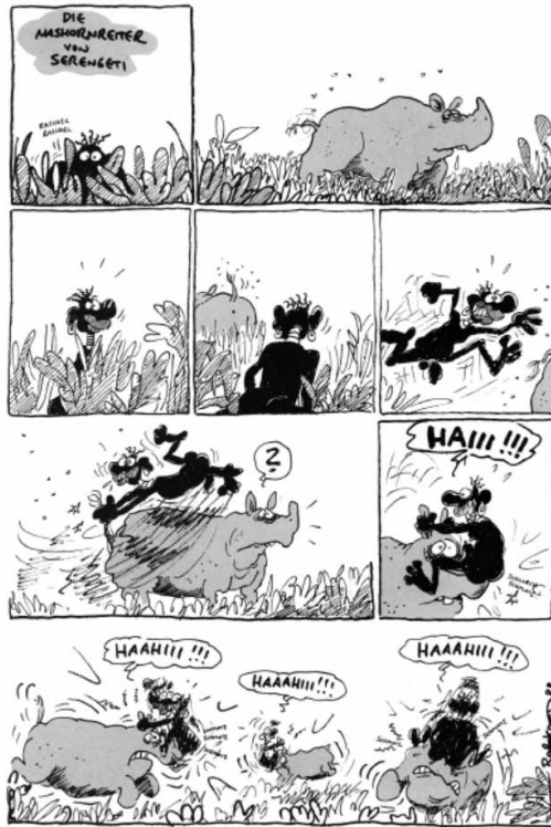
Bild 2: Einseitiger Comic Ralf Königs, der „Die Nashornreiter von Serengeti“ heißt. Im Comic steigt ein nackter, schwarzer Mann absichtlich auf ein Nashorn, um sich mithilfe des Horns zu masturbieren.

„Die Nashornreiter von Serengeti“, Ralf König, Zitronenröllchen und andere Schwulcomix , S.10, Carlsen