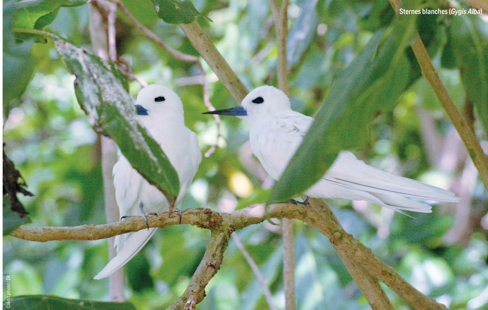
Sternes blanches ( Gygis Alba )