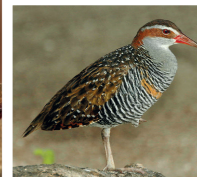
Talève sultane (ci-dessus) et Râle tiklin (ci-contre),

- l'oiseau mangeur d'hommes : par exemple à Tokélaou (île de Nouvelle-Zélande), un matuku , une aigrette sacrée mangeuse d'hommes, enlève une jeune fille, Sina, pour en faire sa femme ; mais les deux frères de Sina parviennent en fin de compte à tuer l'oiseau ;