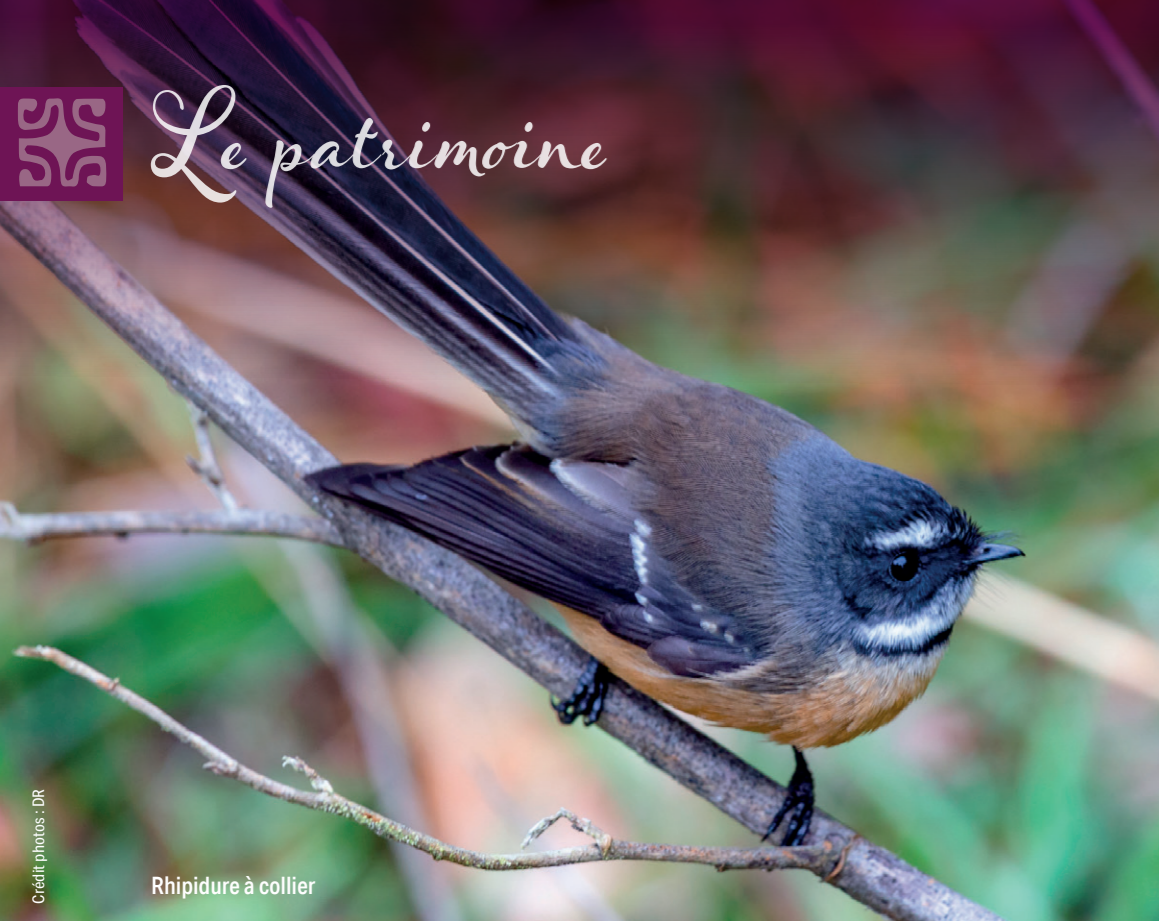
Rhipidure à collier