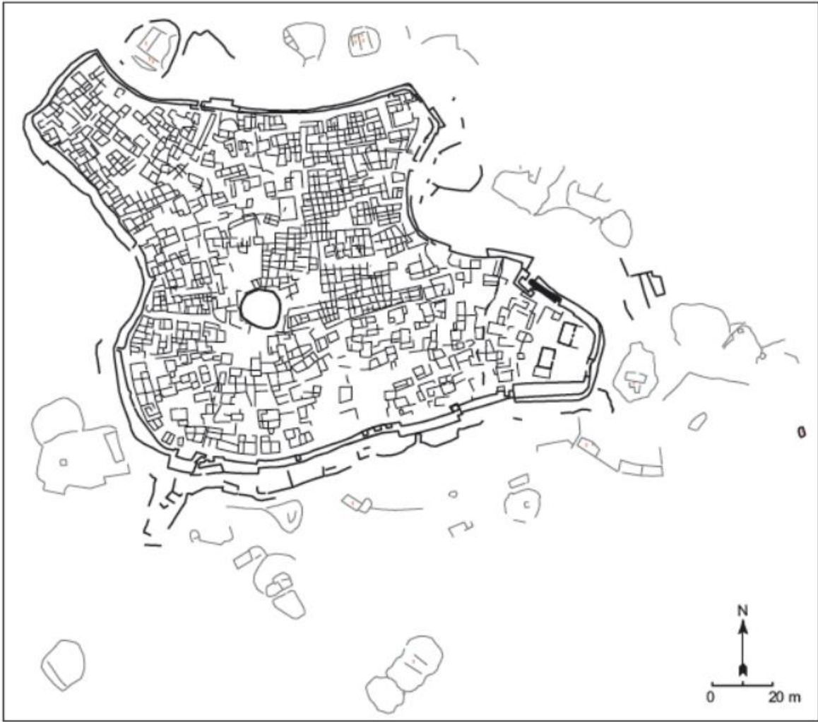
Figure 3 : Plan général de Labwe, Syrie du Sud (Al-Maqdissi et Braemer 2006, p. 117, fig. 3).

Michel Al-Maqdissi et Frank Braemer, « Labwe (Syrie) : une ville du Bronze ancien du Levant Sud », Paléorient , n° 32/1, 2006, p. 113-124.