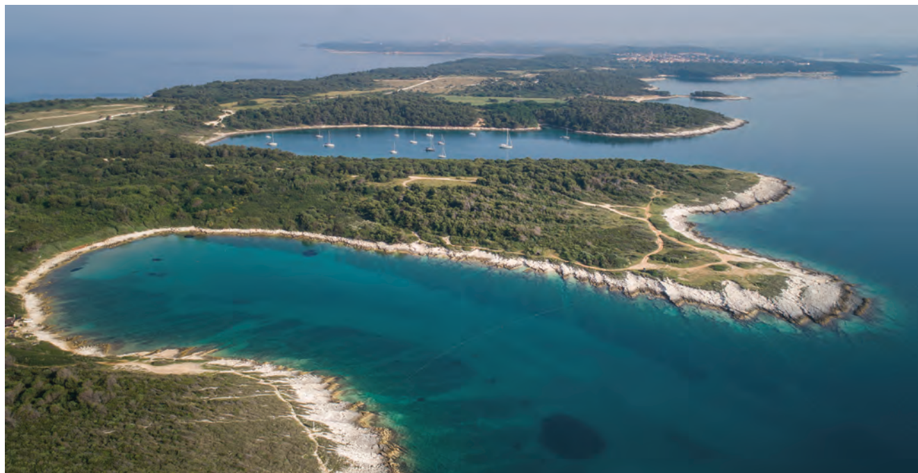
Pogled na uvalu Debeljak / Vue de la baie de Debeljak

Suradnja s Arheološkim muzejom Istre nastavila se od 2017. do 2019. godine tijekom istraživanja kasnoantičkog brodoloma kod rta Debeljak, na južnom kraju istarskog poluotoka.