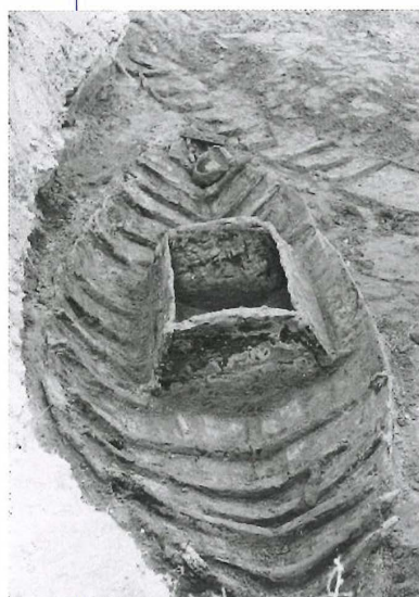
La petite barque de pêche Fiumicino 5 équipée d'un vivier interne (II e siècle). Photographie Parco archeologico di Ostia antica, 1959.

est équipée d'une sorte de caisson, le fond de la carène étant percé pour permettre la circulation de l'eau à l'intérieur de ce vivier. Mais déjà Athénée de Naucratis, dans sa description du gigantesque navire Syracusia du tyran Hiéron II qui gouverna Syracuse au III e siècle av. J.-C., mentionne la présence d'un vivier à poissons situé à la proue et rempli d'eau de mer.