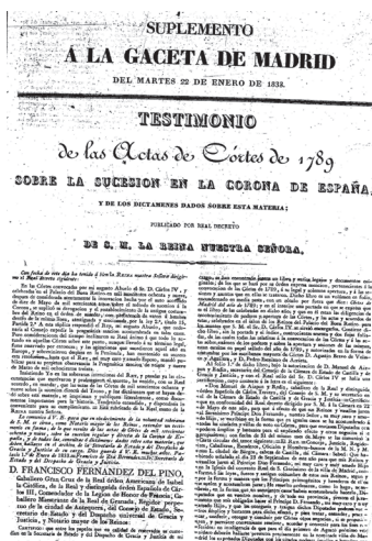
Colección du B.O.E.

Bien qu'elle eût recouvré son « simple » statut de reine consort, sa présence dans le périodique officiel ne pâlit guère. Le titre du Testimonio de las Actas de las Cortes de 1789 sobre la sucesión a la Corona de España... , objet d'un supplément de la Gaceta du 22 janvier, précisait que c'est à un décret de la reine que l'on devait cette publication, dont l'importance fut en outre soulignée par une présentation graphique aussi inhabituelle que soignée.