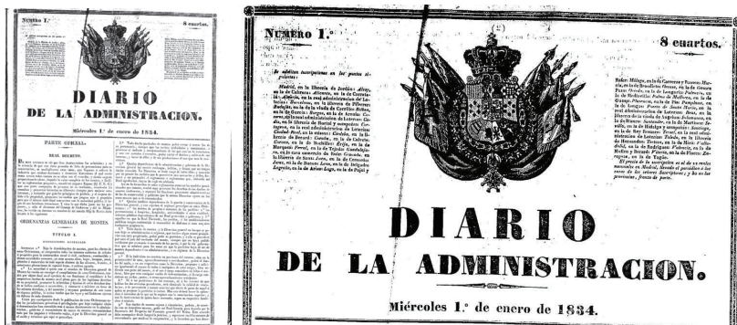
Biblioteca Nacional de España.

un hommage appuyé à l'action déployée par Isabelle la Catholique, érigée en modèle, qui par une sage administration avait fait la grandeur de l'Espagne 73 .