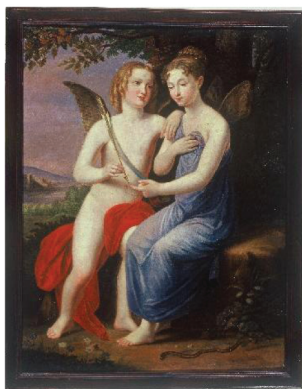
Cupidon et Psyché, par Marie-Christine, Museo de Historia de Madrid, 64 x 51 cm.

La publicité faite à certains ouvrages fut parfois l'occasion de souligner en outre l'étendue des centres d'intérêt de la reine. Ce fut le cas au mois de février avec un traité technique sur le cheminement et la gestion des eaux ( Tratado sobre el movimiento y aplicaciones de las aguas ) auquel, souligna-t-on, la reine avait souscrit 65 . Les félicitations de l'Académie Royale des Sciences naturelles et des Arts de Barcelone, publiées également en février 66 , furent l'occasion de mettre en avant la modernité d'une reine à qui l'on devait la création du Ministère du développement 67 . Enthousiasme partagé, dans un tout autre domaine, par les membres cette fois de l'Académie Royale des Beaux-Arts de San Fernando à qui la reine avait offert le 7 avril une huile sur toile signée par elle.