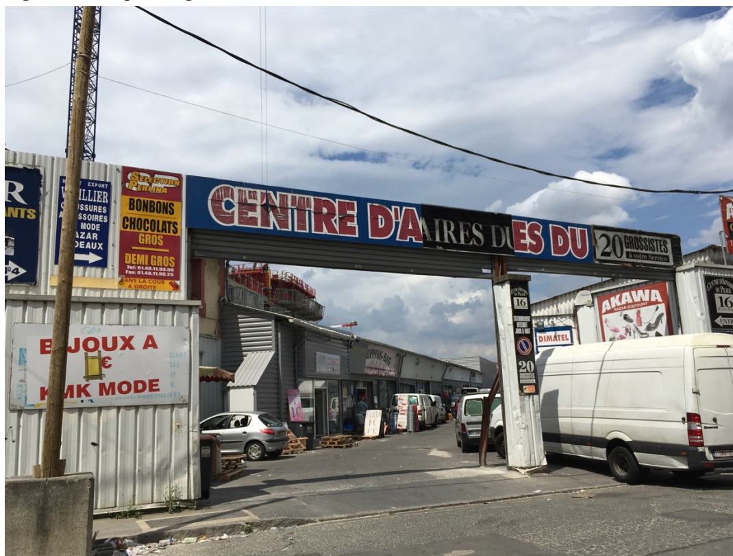
Figure 3. Entrepôts de grossistes à Aubervilliers, rue du Pilier

Le campus est aussi limité à l'est par une vaste zone d'entrepôts entièrement dédiés au commerce textile, premier centre grossiste européen (Chuang 2018, p. 51). Si cette zone n'est pas clôturée, les rues adjacentes sont ici largement congestionnées et les espaces publics très encombrés par les activités (Figure 3).