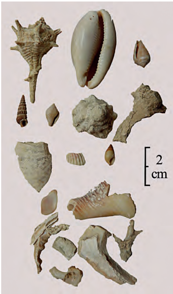
Fig. 6 — Variabilité des états de conservation du matériel conchyliologique. A. Renaud.

permettant de reconnaître un dépôt volontaire. Outre la possibilité de restes de consommation, on doit également envisager l'éventualité de recouvrements du contenu du puits avec des sédiments prélevés dans son environnement proche au cours de son comblement; cette hypothèse s'accorde d'ailleurs avec une volonté d'assainissement du secteur dont la salubrité était remise en cause à chaque évacuation de cadavres.