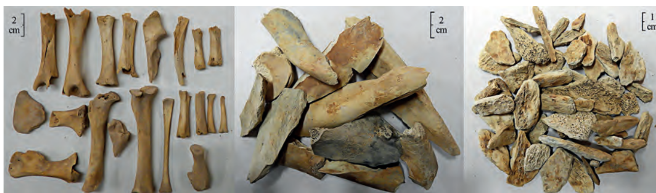
Fig. 1 — Variabilité des états de conservation du matériel osseux provenant des grands mammifères. A. Renaud.

et les chiens représentent 3,5 % et 3,3 % de l'assemblage. Les espèces sauvages sont uniquement attestées par quelques ossements de lagomorphes (probablement du lièvre).