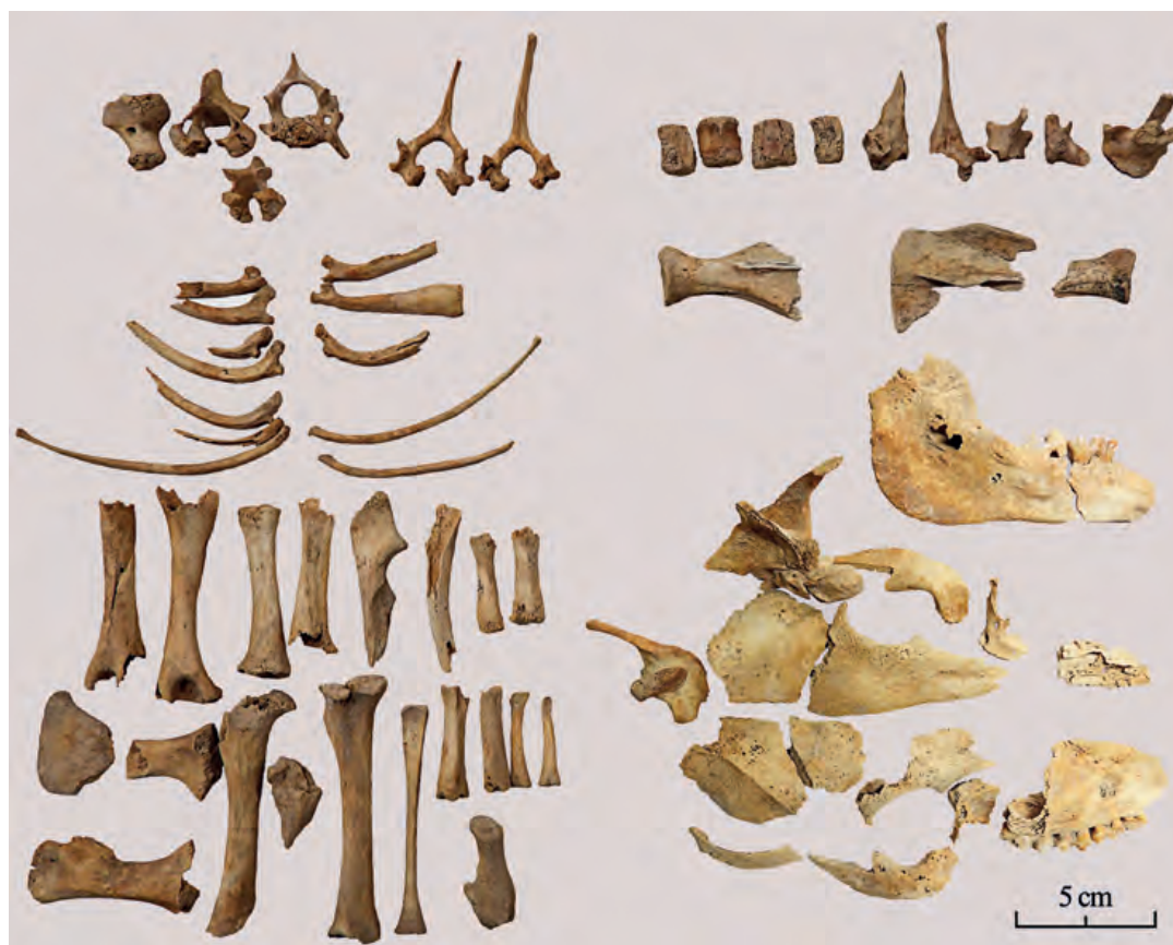
Fig. 2 — Éléments osseux attribués au jeune porc n° 4 (âge : 4-6 mois). A. Renaud.

Ce premier groupe de porcins (individus immatures) est caractérisé par une bonne représentation anatomique des squelettes (tabl. 2 ; fig. 2), des surfaces osseuses exemptes d'altération et une absence totale de traces liées au traitement boucher des carcasses. Les fœtus et le nouveau-né font exception, avec une conservation osseuse partielle, mais il est nécessaire de considérer différents phénomènes, notamment la percolation des petits éléments vers le fond du puits (niveaux non fouillés) et la fragilité des éléments (os plus poreux) qui ont pu jouer un rôle dans la variabilité des conservations anatomiques et qui sont susceptibles d'expliquer l'absence d'une partie des restes squelettiques. Les ossements témoignent du rejet de squelettes entiers de porcelets, de jeunes porcs et d'un individu presque à terme. Quant à l'unique reste rattaché à l'un des fœtus (65-70 jours), il est difficile d'établir de manière certaine s'il appartient à un squelette complet dispersé et disparu ou bien s'il provient d'une femelle gravide.