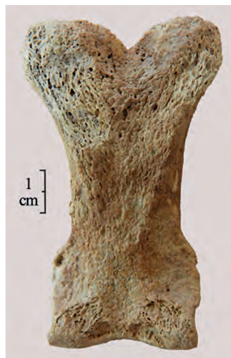
Fig. 4 — Première phalange d'équidé présentant de légères exostoses osseuses sur les faces latérale et médiale de la partie distale. A. Renaud.

Un dernier processus de rejet est identifiable au sein du comblement, celui de l'introduction de cadavres entiers de porcelets et de jeunes porcs, voire d'individus avortés ou de mort-nés (périnataux). Ces individus ne sont pas passés dans le circuit alimentaire, ce qui invite à s'interroger sur les causes de cette exclusion et donc sur les conditions de leur mort. Aucun indice ne prouvant un abattage volontaire, plusieurs hypothèses peuvent être proposées. La présence de différentes classes d'âges dès le stade embryonnaire suggère une mortalité atteignant les individus fragiles (juvéniles et femelles gravides) ou malades, dont les cadavres ont été directement évacués dans le puits pour des questions sanitaires (le lieu de mort se trouvant à proximité). Les morts de ces porcelets s'étalent sur plusieurs saisons si l'on considère les âges estimés (du périnatal au porc de 9 mois), ce qui suggère des rejets successifs et non pas concomitants. Les individus morts in utero indiquent également l'abattage de femelles