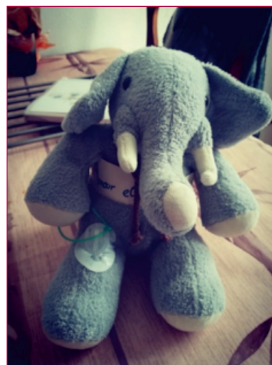
Figure 3. La peluche sert d'essai pour poser le cathéter.

• Surtout, la distanciation n'empêche pas un accompagnement régulier. La socio-anthropologie de la santé a montré que les soins sont encadrés par la sphère familiale [24]. Les jeunes peuvent à la fois revendiquer de s'occuper de leur diabète au quotidien seul et s'appuyer sur leurs parents pour aller aux consultations, faire le point sur les indications du médecin, discuter avec eux de la stabilité ou instabilité de leurs courbes ou d'autres types de thérapies à suivre. • Certains semblent même vouloir que les adultes, soignants et parents, prennent en charge le plus longtemps possible les soins liés au diabète afin de ne pas se charger mentalement ou risquer