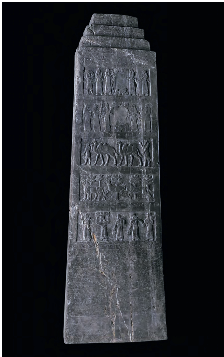
Fig. 5. Vue de l'Obélisque noir de Salmanazar III. Le 4 e registre montre la faune sauvage vivant sur les rives du moyen Euphrate