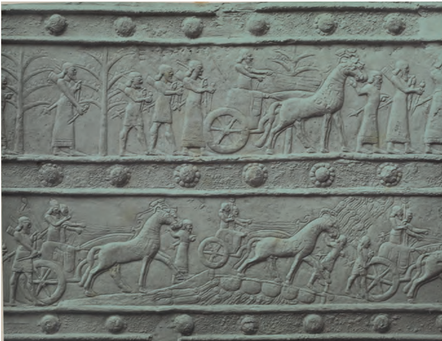
Fig. 7. Détail de la bande de bronze XI de Balawat (règne de Salmanazar III). Un char franchit l'Euphrate sur un pont de bateaux (BIRCH et PINCHES 1902, pl. 74)