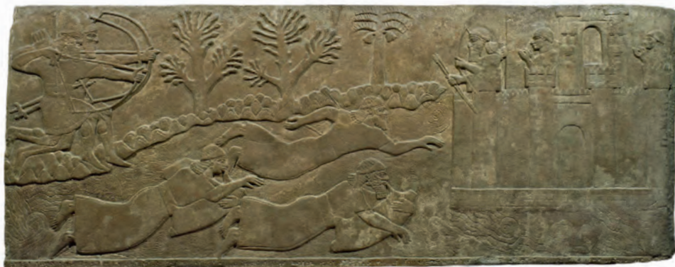
Fig. 3. Bas-relief montrant la fuite de Kudurru vers l'île euphratique de Telbis

scènes représentées 72 , ce qui complique singulièrement leur identification et leur interprétation. Cependant, trois séquences montrent vraisemblablement l'Euphrate.