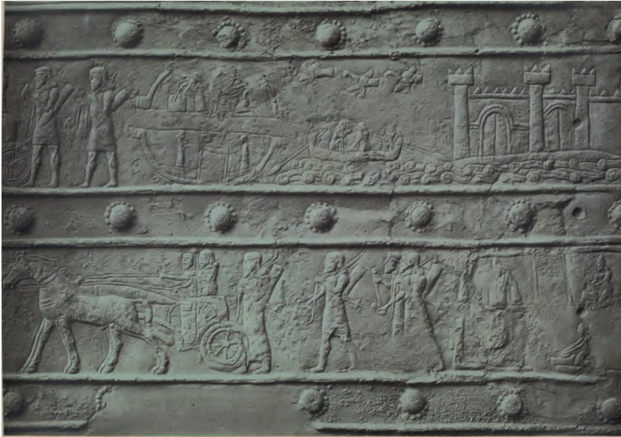
Fig. 6. Détail de la bande de bronze V de Balawat (règne de Salmanazar III) illustrant probablement l'Euphrate et la ville de Til Barsip (BIRCH et PINCHES 1902, pl. 32)