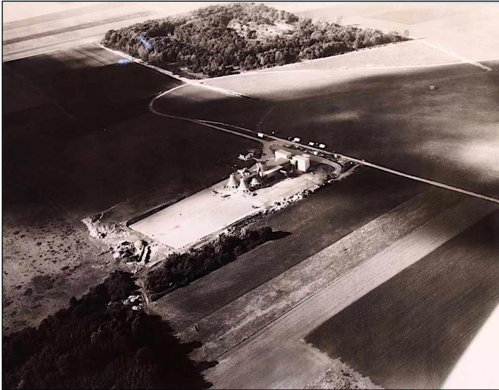
Figure 1. Photo aérienne de l'usine de compostage TRIGA de Versailles située à Buc, sur le plateau de Saclay au sud de Paris, en novembre 1966. L'usine est édifée au milieu des champs en grandes cultures qui dominant déjà largement le paysage agricole très spécialisé du plateau. Tout juste construite, elle n'a pas encore débuté son activité comme l'indique l'absence d'andains sur l'aire dédiée, à l'arrière de l'usine.

lui accorde une place très conséquente dès lors que l'on sort de la zone urbaine centrale (Paris et communes limitrophes) 23 .