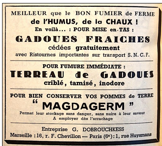
Figure 2. Assimilation des ordures ménagères au « bon fumier de ferme » dans une publicité de l'entreprise Georges Dobrouchkess qui est chargée de l'évacuation des ordures de nombreuses communes franciliennes dans les années 1950. La propagande s'inscrit dans les « croisades de l'humus » et la promotion de la fertilisation calcaire (chaux) qui prend un large essor après-guerre.

l'heure des « croisades pour l'humus » 50 – est la manifestation la plus évidente de la référence aux savoirs, à la tradition et à l'autonomie paysanne pour la défense et l'établissement de la valeur des ordures traitées, qui se fait ainsi « au nom des souvenirs » 51 . Très répandue, elle se retrouve dans tous les discours ou presque ainsi que dans les publicités que l'on trouve dans les revues agricoles (figure 2). Les agronomes comme les ingénieurs sanitaires des entreprises spécialisées dans le compostage qui se développent à partir des années 1950 ne cessent de l'y comparer 52 , et mettent ainsi en avant ses qualités comparables voire, parfois, ses teneurs plus élevées en certains éléments et en matières organiques. L'argument est souvent renforcé par la raréfaction du fumier animal, de surcroît dans certaines régions comme la région parisienne ou la Champagne où la spécialisation et l'intensification toujours plus poussées des cultures évincent l'élevage 53 . On peut ainsi lire, entre autres formules similaires, que « pour l'agriculture [...] le compost des villes constituerait un substitut précieux de même valeur au moins que le fumier actuellement employé » 54 . Présenté comme « succédané » de ce dernier 55 , il se voit ainsi paré de qualités encore partiellement, mais de plus en plus résiduellement à mesure que s'imposent les engrais chimiques, reconnues par les cultivateurs.