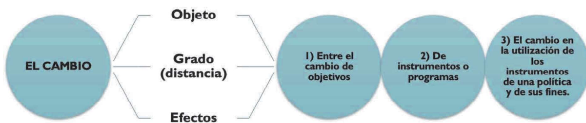
Figura 2. Tres órdenes de cambio