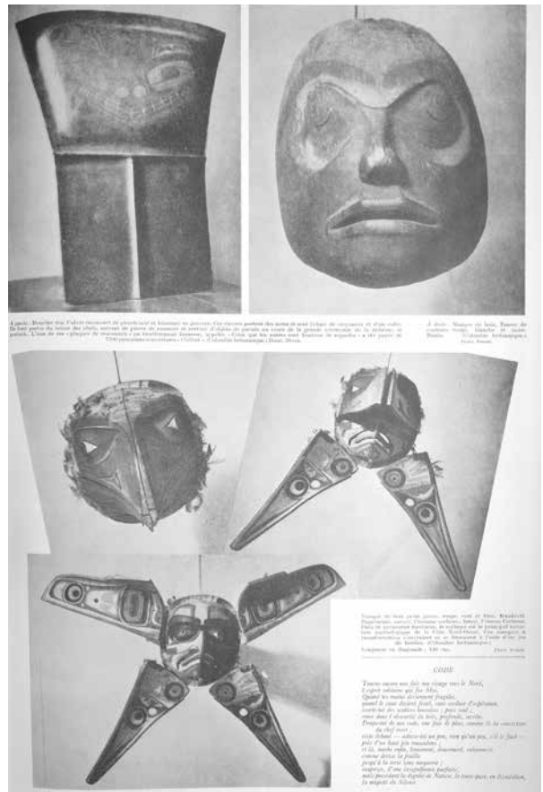
5. Georges Duthuit, « Le don indien », dans Labyrinthe , n° 18, 1er avril 1946, p. 11.

– Sonny Assu. Les artistes autochtones ont joué un rôle clef en écartant le potlatch de la vision occidentale et du paradigme du sauvage. Parler de résurgence semble indiquer que le potlatch a disparu pendant un temps. Or la pratique s'est poursuivie, même pendant la