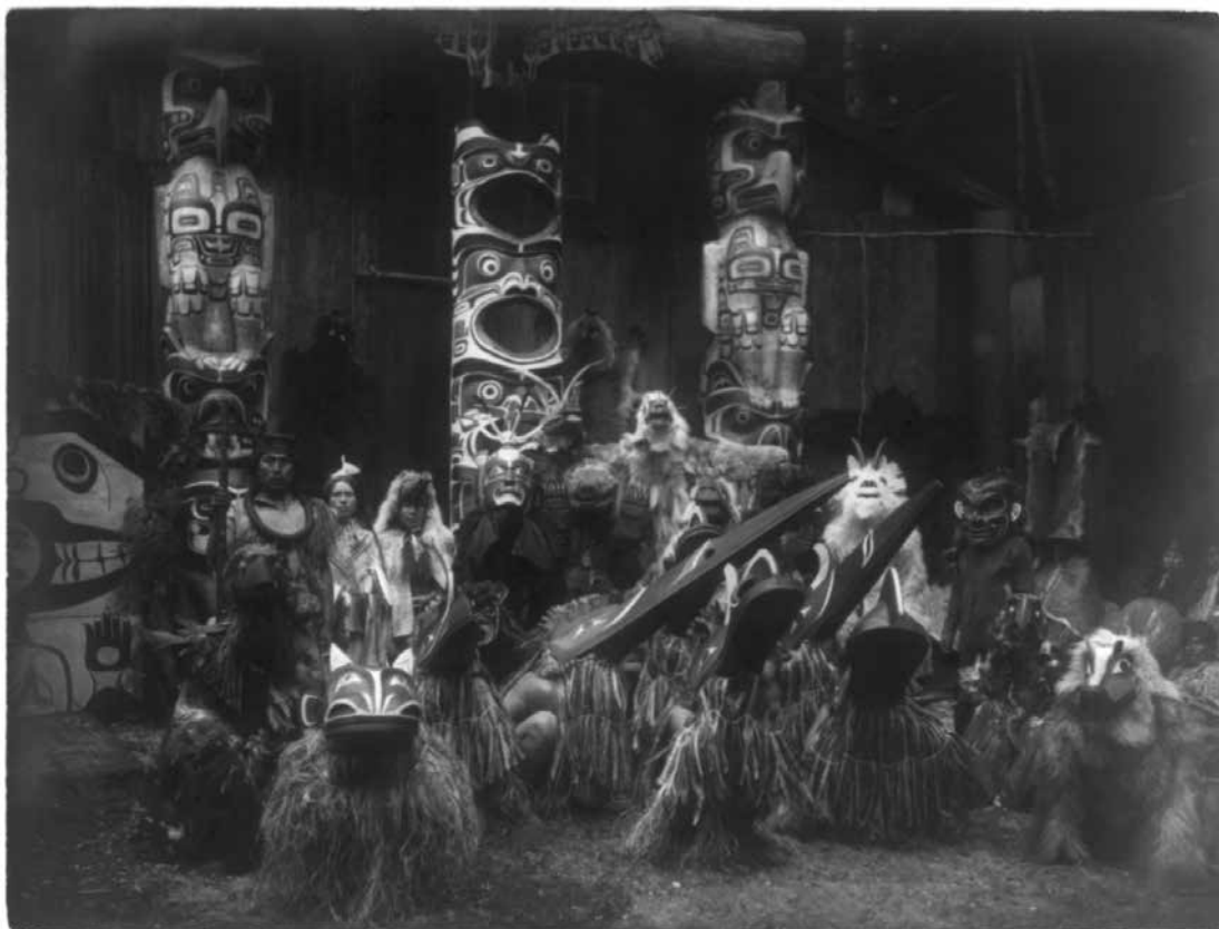
8. Edward S. Curtis, Masked dancers – Qagyuhl , 1914, photogravure, 31 × 43 cm, Washington, DC, Library of Congress, Prints and Photographs Division.