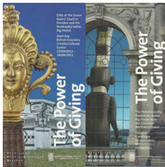
3. Double visuel de l'exposition The Power of Giving: Gifts in the Kwakwaka'wakw Big House from the Canadian Northwest Coast and at the Saxon rulers' court in Dresden , Alert Bay, U'mista Cultural Centre / Dresde, Lipsiusbau, Staatliche Kunstsammlungen Dresden, 2011.