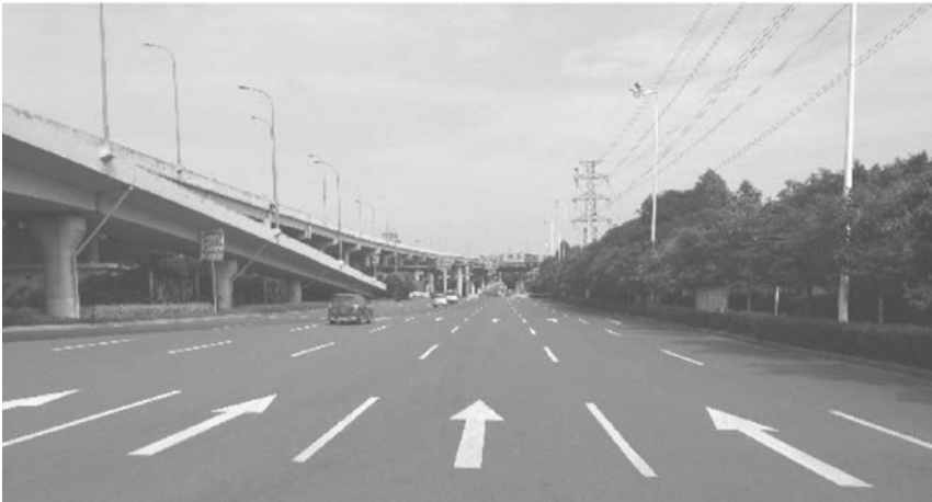
Photographies : auteurs, 2011, 2013, 2014.