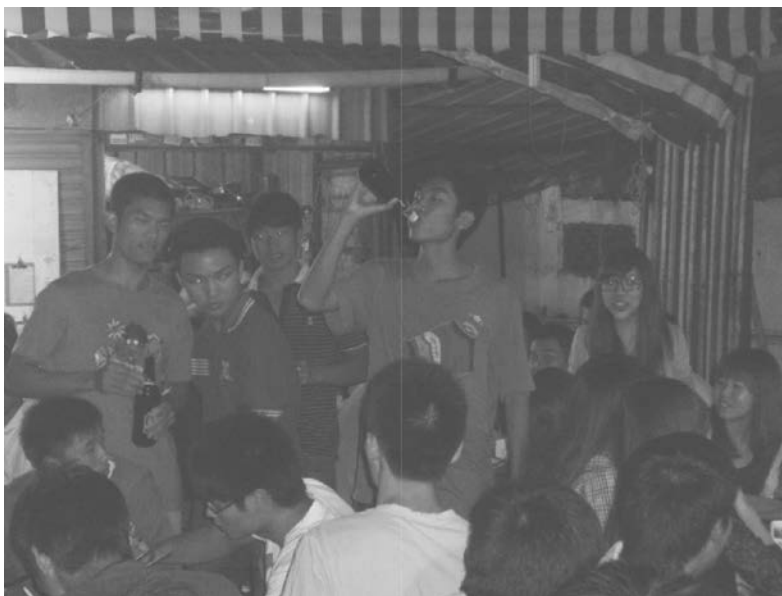
Photographie : auteurs, octobre 2011.

Dans le village de Nanting , une économie singulière et spatialisée est facilement identifiable et matérialisée. À proximité de l'université des beaux-arts de Canton, une vingtaine de petites échoppes de pinceaux, encadrement, dessins sont disséminées dans une des artères du village. Ces économies de niche, très spécialisées, sont liées aux conjonctures locales et aux effets d'aubaine – en matière d'opportunité d'emplois – perçus par les migrants.