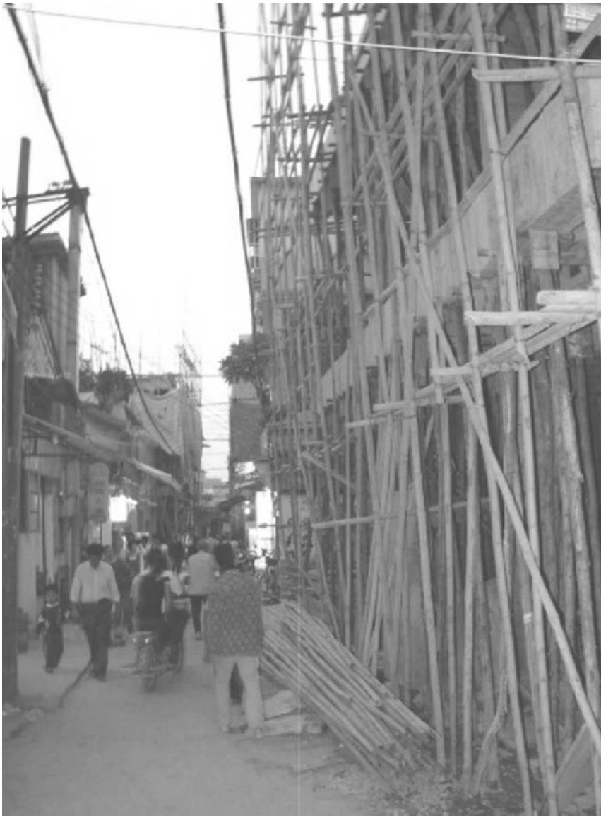
Photographie : auteurs, octobre 2011.