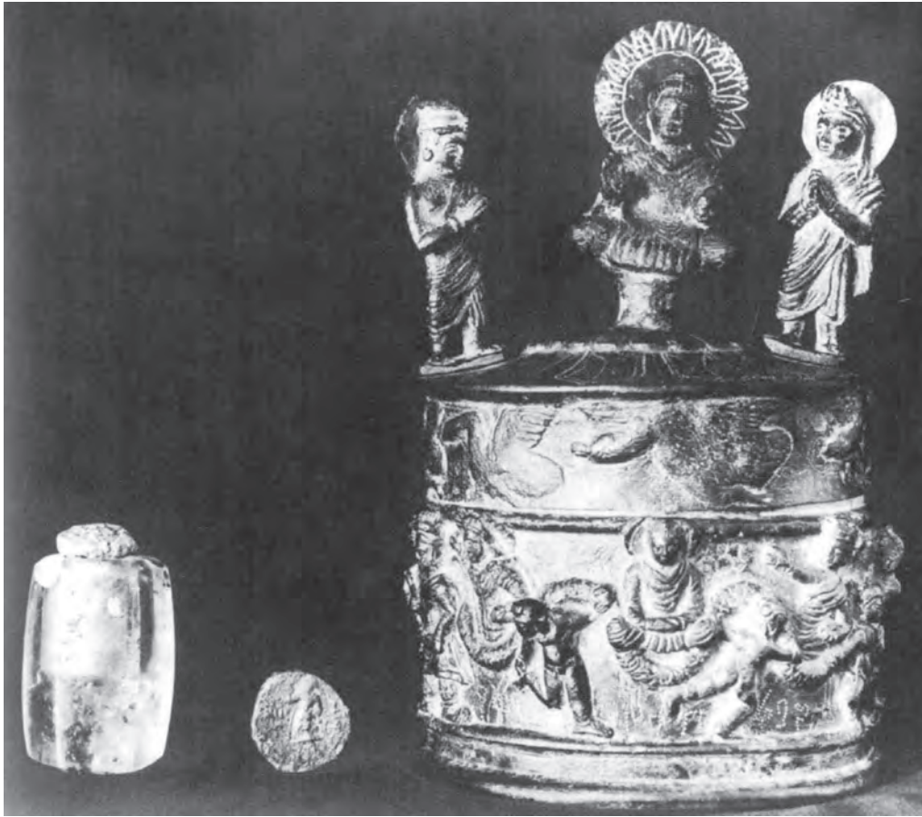
Fig. 7 – Le reliquaire de Shāh-jī-kī-Dherī, la monnaie de Kanishka et le cristal avec le “sceau” : photo de 1909. D’après ERRINGTON 2005, fig. 1.

Mais qu’en est-il du reliquaire lui-même? Celui-ci ne porte pas de trace d’usure et semble avoir été déposé peu de temps après sa fabrication. Mais, si l’on en croit des photos de fouilles conservées à Londres et jusqu’ici négligées, il se pourrait que le cachet que signale Spooner soit en réalité une monnaie, recouverte d’argile, au type du roi kouchan Huviška (153-191) à dos d’éléphant.