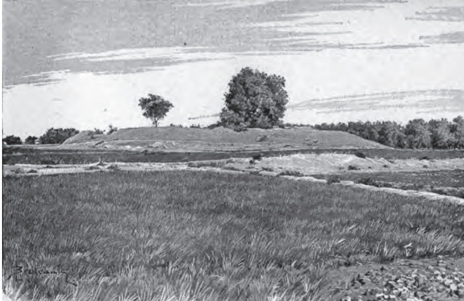
Fig. 4 – L'emplacement du stūpa vu par Foucher en 1897. D'après FOUCHER 1901b, fig. 40, p. 217.

En tous cas, l'idée communément répandue que c'était là le site de la fameuse pagode du roi Kanishka nous paraît être l'invention d'un mounshi 51 honteux de rester court ou désireux de plaire. Pour retrouver les ruines de ce monument jadis si célèbre, le mieux, à notre avis, est de suivre à la lettre les indications topographiques, toujours si exactes, des pèlerins chinois: or, à la distance et dans la direction spécifiées par eux, à deux km au sud-est de la ville, sur la route du Hazar Khani, des tertres encore considérables bien que depuis longtemps en exploitation réglée, marquent en relief sur les champs environnants le plan caractéristique des fondations bouddhiques et portent le nom significatif de Shâh-djî-kî-Dhêrî, le tumulus du roi;