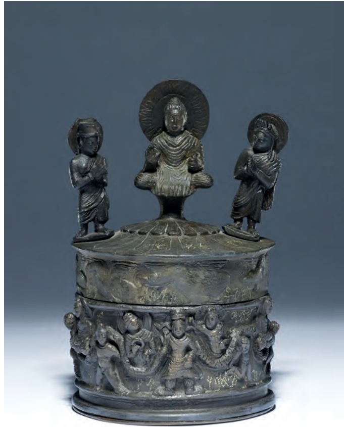
Fig. 8 – Le reliquaire de Shāh-jī-kī-Dherī (copie), inv. 1880.270.

“In other words, authentic relics of the Buddha himself!”