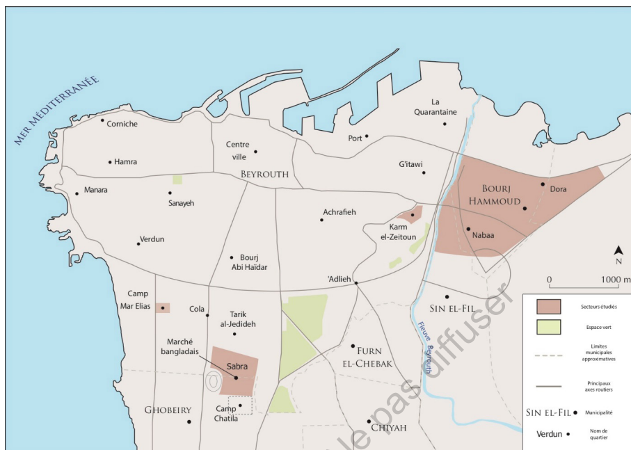
Carte 1 : Carte de situation de Beyrouth et des terrains d'enquête

Conception : A. Dahdah.