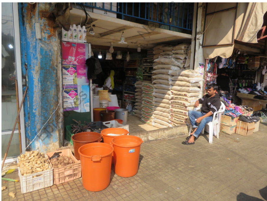
Beyrouth, décembre 2019.