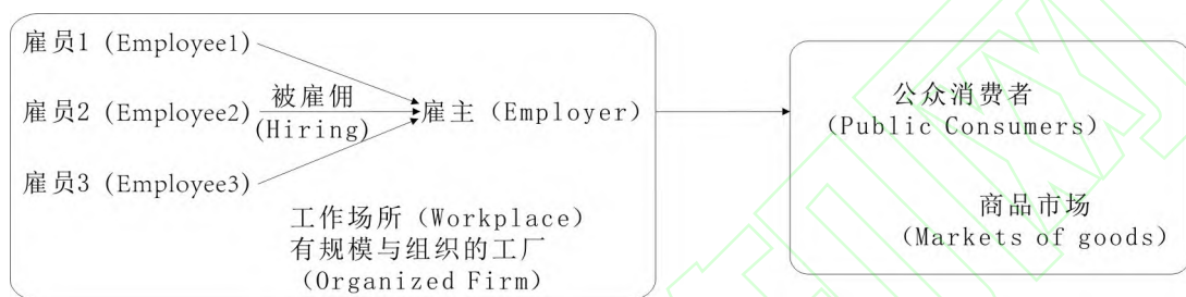
图2 劳动合同的逻辑

这些立法讨论、活动及相关法律条文的陆续出台使“雇佣劳动”一词的界定更为明晰,它强调“劳动”是一名“雇员”的定期个体活动,且服务对象为承诺支付其工资的“雇主”(可以是个体,也可以是群体代表)。这里的“劳动”是与生产紧密相关的活动,不仅包括体力劳动(如手工作坊中的熟练工),也包括脑力劳动(如医生、律师、工程师)。与此同时,这种个体活动应遵循双方签订的劳动合同,雇员完成合同规定的工作,雇主支付应给予的工资。在这一过程中,个体劳动合同构建了一个新群体:他们和同一个雇主签订劳动合同,并一起参与商品的生产过程。从这个意义上来说,劳动合同将“工作”明确为个体的具体经济活动,这一活动在雇员与雇主之间发生,且促成了服务同一雇主的雇员集团(La Collectivité)的出现 [20] (见图2)。