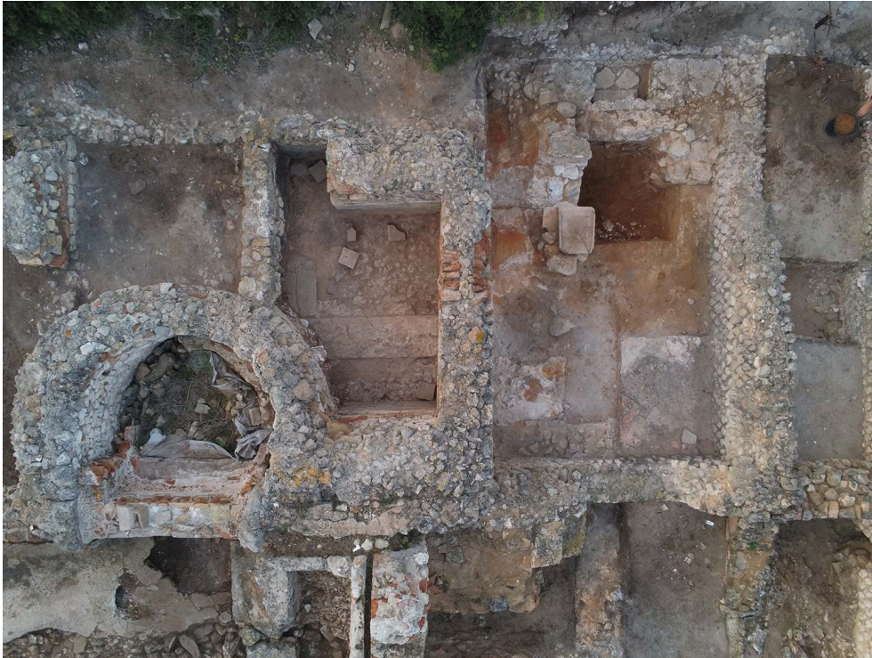
Fig. 2 – Vue zénithale des secteurs fouillés dans les bains en 2018