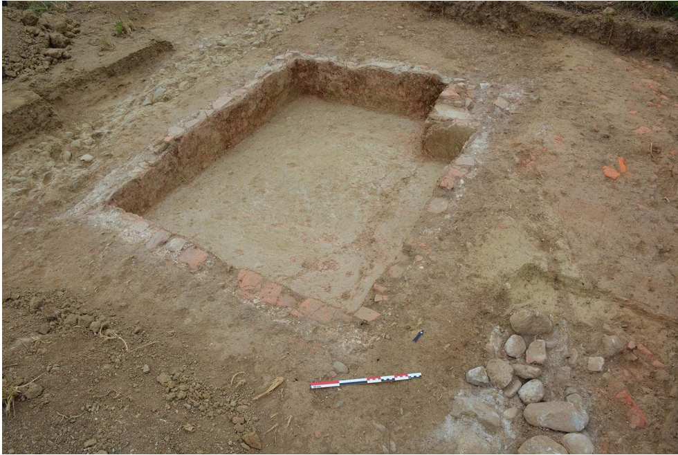
Fig. 1 – Cuve enduite de mortier hydraulique, située dans le bâtiment