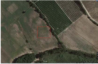
Fig. 2 – Vue aérienne et hypothèse de restitution du plan de l'établissement littoral de Piede Tignoso, à partir des sondages de 2019