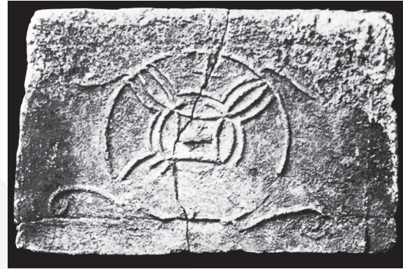
Fig. 4. Relevé du panneau de Saint-Germain-des-Prés (d'après Périn dir. 1985, 355 n° 316).