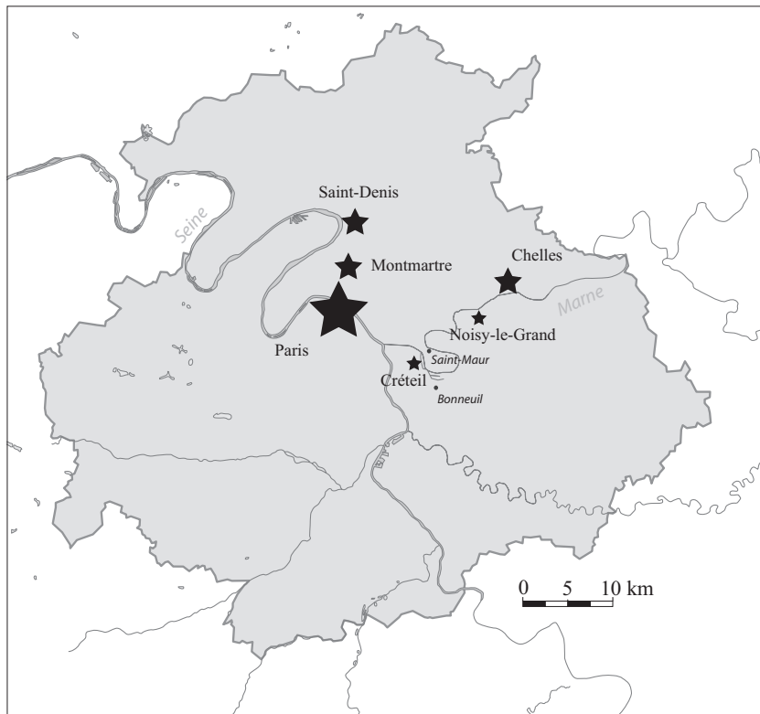
Fig. 1. Localisation des nécropoles comportant des sarcophages utilisant des moules parisiens, au sein de l'emprise présumée (en gris) du diocèse parisien à l'époque mérovingienne (dessin S. Ardouin).

Les panneaux de sarcophages utilisés dans les nécropoles mérovingiennes parisiennes (fig. 1) présentent des décors plus élaborés et une finition plus soignée que ceux des autres nécropoles d'Île-de-France 13 . Hors des nécropoles parisiennes, les sarcophages à décors, produits à partir de moules parisiens, sont rares 14 , actuellement identifiés sur cinq sites. Les sarcophages découverts dans les nécropoles associées à l'abbatiale de Saint-Denis (Seine-Saint-Denis) et aux anciennes églises Saint-Barthélémy et Saint-Pierre présentent plusieurs décors identiques aux sites parisiens 15 . La nécropole associée à Saint-Denis de Montmartre, aujourd'hui sur le territoire parisien, était originellement isolée des nécropoles suburbaines. Elle a révélé plusieurs moules utilisés dans plusieurs nécropoles parisiennes et à Saint-Denis 16 . Des sarcophages conçus à partir de moules parisiens ont aussi été découverts à Chelles (Seine-et-Marne) dans l'abbatiale Notre-Dame et l'église Saint-André 17 , à Créteil et très récemment en 2008-2009 à Noisy-le-Grand dans la nécropole des Mastraits 18 .