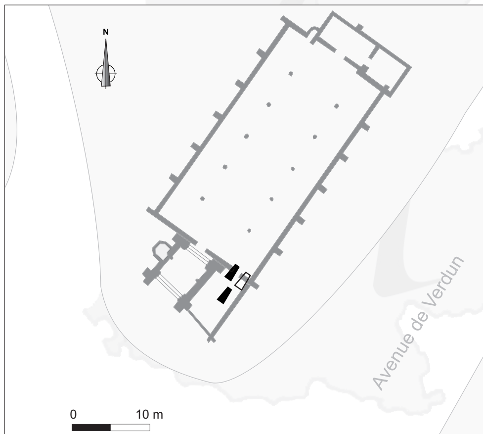
Fig. 3. Localisation des deux sépultures (en noir) et du sarcophage de plâtre (en blanc) dans l'église Saint-Christophe (dessin S. Ardouin, T. Galmiche).

Éléments sous droit d'auteur - © Aquitania janvier 2015