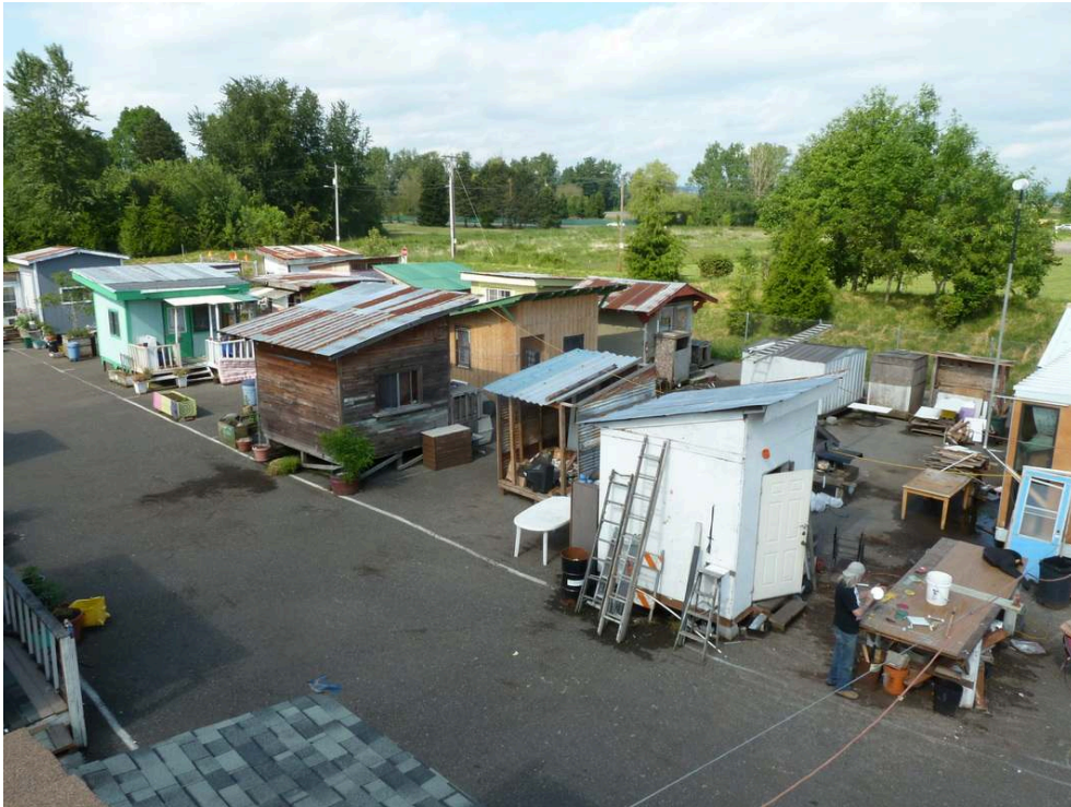
Figure 1 et 2 : Les « villages » R2DToo et Dignity Village

développement de différents « villages », soutenus par la municipalité, et permettant de pallier le manque de places en refuge.