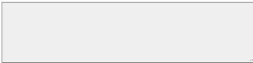
Figure 3. Question ouverte posée dans l'enquête en ligne.

Vous pouvez évoquer par exemple les points positifs ou négatifs du mouvement, son efficacité, son évolution, les réponses apportées par le gouvernement, pour quelles raisons soutenez-vous ou participez-vous à ce mouvement, etc.