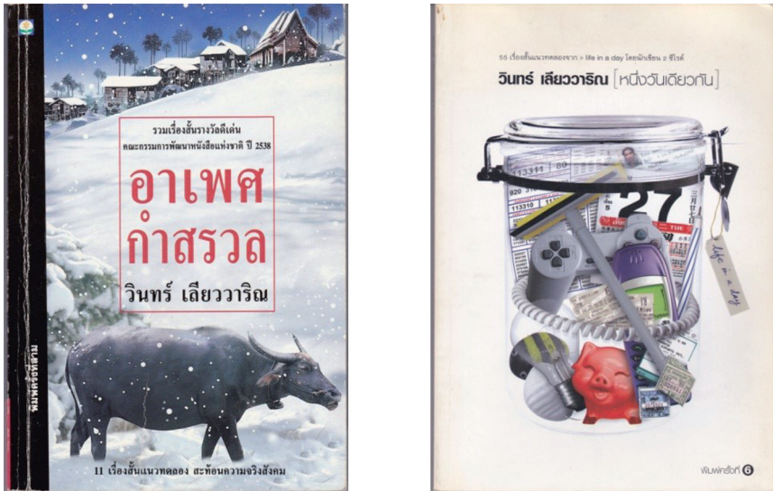
Fig. 1. Un graphisme recherché

Depuis le début de son travail d'écrivain, Win cherche de nouvelles formes d'écriture. Sa formation d'architecte et de graphiste participe de façon totalement imbriquée à son style d'écriture. Au-delà du texte, il intègre de multiples éléments de mise en page ou de graphisme qui éclairent et complètent l'écrit.