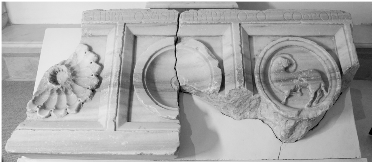
Figure 1 : Les deux fragments de marbre inscrits provenant d'Emmaüs-Nicopolis et conservés à Latroun.

Quand les Latins s'installent sur le site de Nicopolis, l'église byzantine n'est plus que décombres, comme en témoigne l'higoumène russe Daniel 1106. 7 Le statut qu'acquiert le site n'apparaît guère explicitement dans les sources et le fait que deux lieux soient rattachés à l'Emmaüs biblique entraîne des confusions. 8 Abel pensait à un édifice templier du fait de la proximité avec le Toron des chevaliers (Latroun), forteresse bâtie à un kilomètre au sud par le comte espagnol Rodrigo Gonzalez de Lara et confiée par lui à la garde des Templiers. 9 Pour Denny Pringle, rien ne vient étayer cette hypothèse ; ce pourrait être un bâtiment isolé, servant à la communauté franque locale, ou une église paroissiale cédée aux Hospitaliers sur les terres d'Emmaüs. 10 La représentation de l'Agneau, qui peut être interprété comme symbole de la