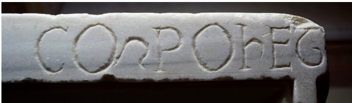
Figure 5 : Inscription gravée sur le marbre : [ Hic/qui metitur aqua ], librat qui sidera palmo, c[o]mponet [---]. Cliché : Estelle Ingrand-Varenne.

Figure 4 : Détail du fragment de droite, avec le mot component entre deux réglures. Cliché : Estelle Ingrand-Varenne.