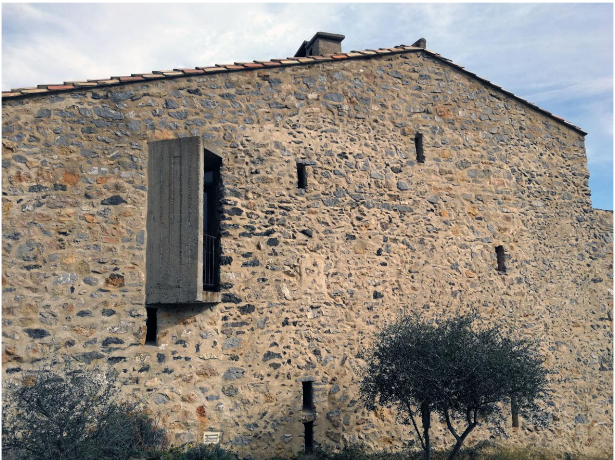
figure 5 : Façade ouest exposée au vent d'une maison rénovée à Treilles (Aude), 1979, architecte : Michel Gerber.