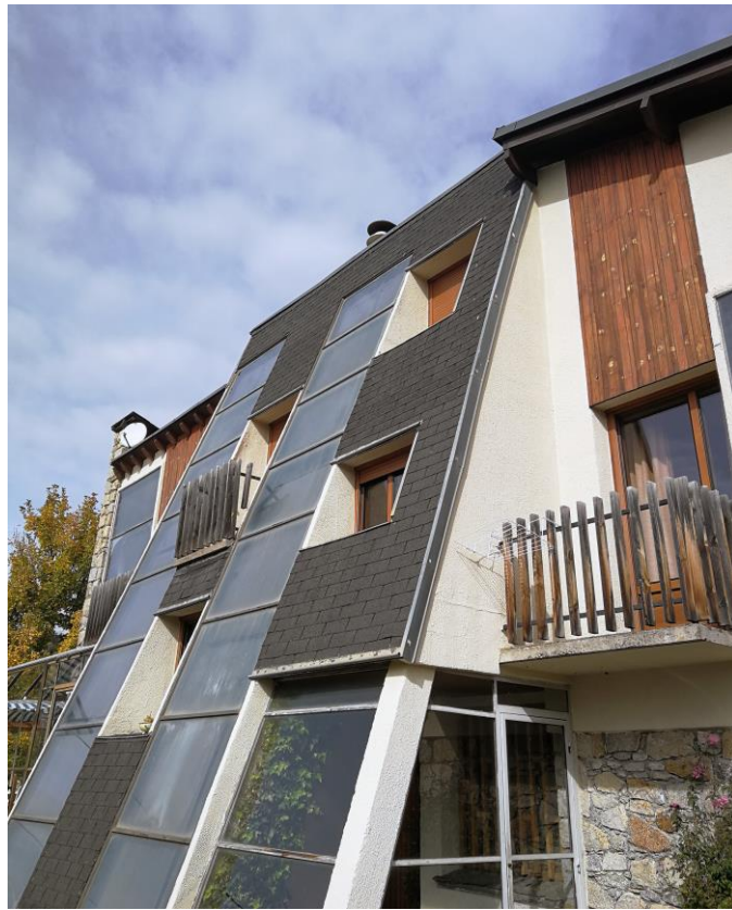
figure 4 : Maison équipée de murs Trombe à Odeillo-Font-Romeu (Pyrénées-Orientales), 1980, architecte et ingénieur : Jean-François Tricaud.