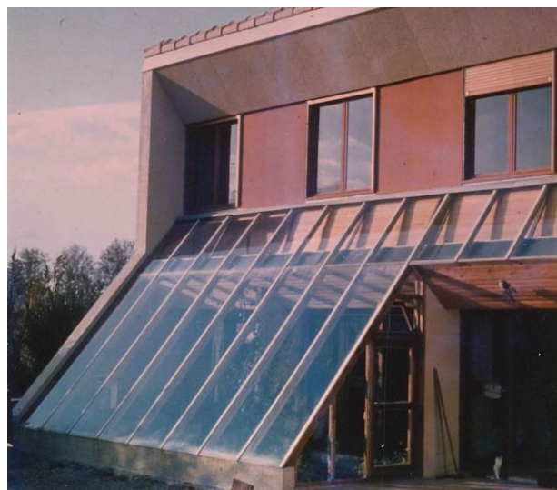
figure 3 : Maison à Ginestas (Aude), 1980, architecte : Michel Gerber