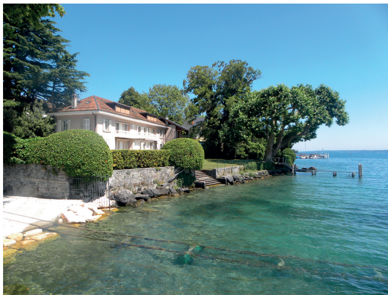
Cas C : rive endiguée, Bellevue, Léman GE, juillet 2018.