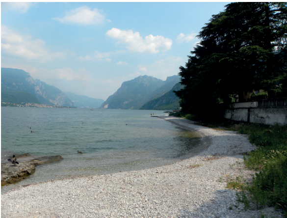
Cas A : grève accessible, Oliveto Lario, lac de Côme, juin 2018.

Dans le second cas de figure, cet espace de transition entre la rive et le lac a purement et simplement été supprimé, rendant l'interface terre/lac beaucoup plus franche (figure 2, cas C). Cela conduit à renforcer l'effet de privatisation, en supprimant cette zone de transition que le public est censé pouvoir pratiquer à pied sec hors période de hautes eaux. Cette suppression passe par deux modalités techniques. Il peut s'agir d'une immersion de la grève, consécutive à un système de régulation qui privilégie un niveau d'eau constant et plus élevé que le niveau moyen antérieur (c'est le cas du lac d'Annecy), ou d'empiètements historiques des propriétés riveraines sur le domaine public du lac, au moyen d'endigages ou de remblaiements (tous les lacs étudiés ont fait l'objet d'empiètements de ce type, autorisés par l'administration ou non).