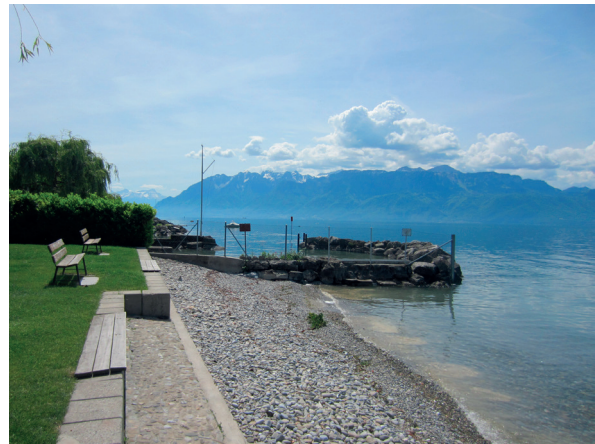
Cas B : grève privatisée, Bourg-en-Lavaux, Léman VD, mai 2017.