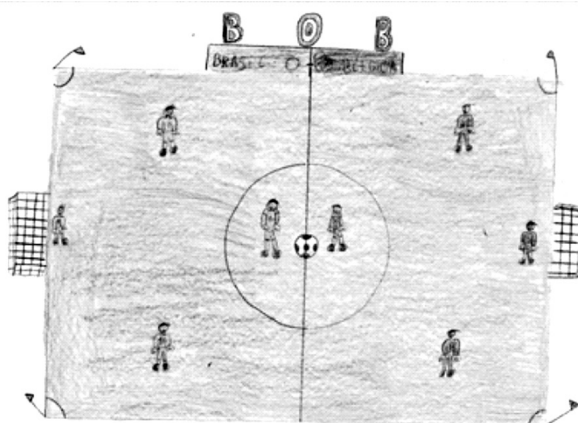
Figura 1 – “Uma partida de futebol” (Bob, 9 anos)