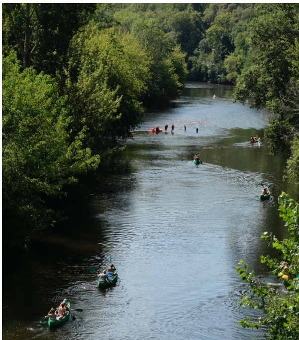
Fréquentation de la Vézère, en milieu d'après-midi, à hauteur du site troglodytique de la Madeleine, dans un environnement très boisé