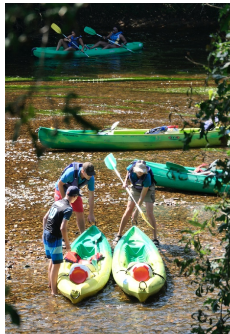
Halte « sauvage », en dehors de toute zone aménagée, sur la Vézère, à hauteur de Tursac. Des herbiers aquatiques sont visibles sur la rivière.