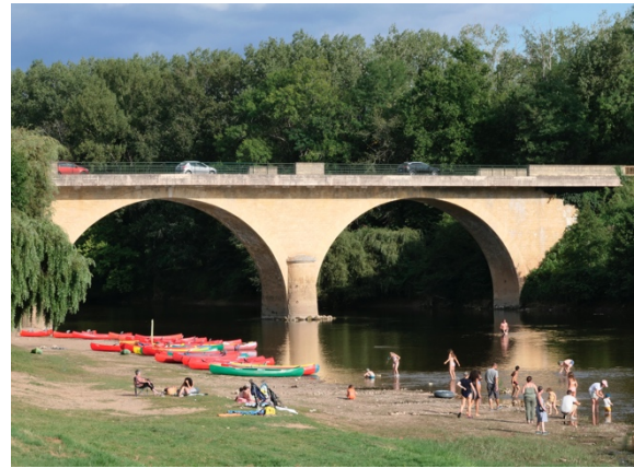
Baignade et halte de canoës, à Limeuil, à la confluence Vézère / Dordogne