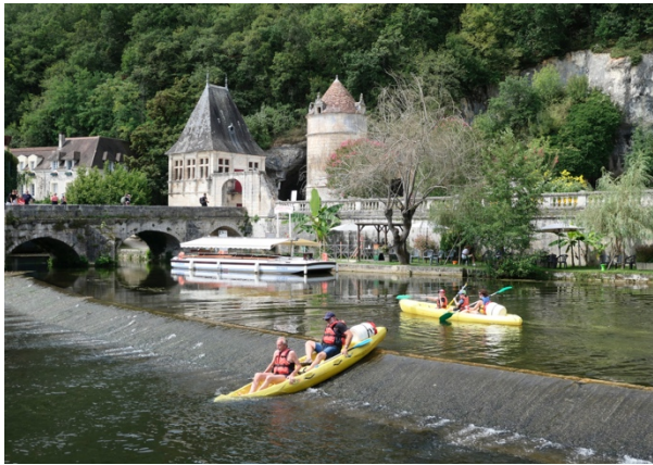
Franchissement difficile d'un seuil sur la Dronne, à Brantôme-en-Périgord